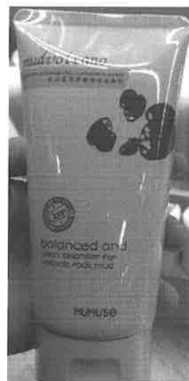
무무소 뉴저지주 매장 판매 상품