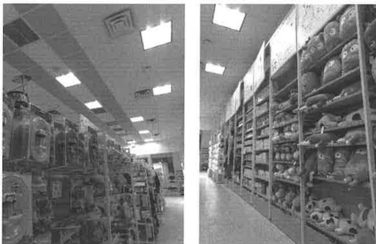
무무소 뉴저지주 매장 내부 진열대 모습

2019년 4월 기준 무무소 공식 웹사이트 http://www.mumuso.com 에 소개된 내용이나 3월 말 뉴욕 IP-DESK의 현장 답사 당시 무무소 뉴저지주 매장에서 Lanham Act 43(a)(1)(B)조항 위반이라고 주장할만한 정황은 눈에 띄지 않았다. 매장에서 근무 중이던 종업원은 한복이 아닌 평범한 옷차림이었고, 매장 내 배경음악은 없었다. "Designed in Korea"라고 적힌 소수의 제품 이외에는 한국을 언급하거나 한국산임을 암시하는 표식이 없었으며, 한글로 적힌 간판, 배너, 매대 사인물, 제품 설명서를 찾아볼 수 없었다.