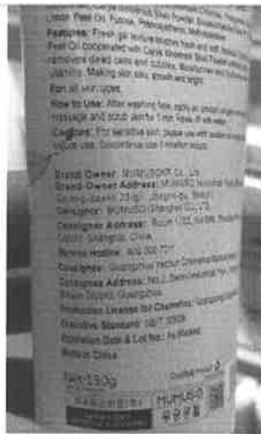
무무소 뉴저지주 매장에서 판매 중인 화장품 라벨