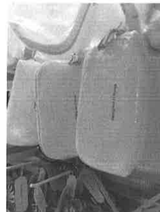
무무소 뉴저지주 매장 내외 모습

한편, 매장에 진열된 제품들은 작은 글씨로 'made in China' 라고 적혀있었다. 제품 라벨에는 Lanham Act 이외에도 공정포장표시법 (Fair Packaging and Labeling Act), 식품의약품화장품법 (Food, Drug, and Cosmetic Act), 식품의약품청 (Food and Drug Administration) 규제, 소비자제품안전위원회 (Consumer Product Safety Commission) 규제, 연방무역위원회 (Federal Trade Commission Act) 규제 등이 적용될 수 있는데, 무무소가 판매 중인 여러 제품에 원산지를 표기함에 있어 기타 위법사항은 없는지 별도로 조사해볼 필요가 있다.