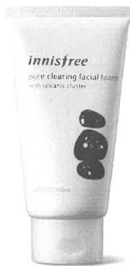
이니스프리 웹사이트 판매 정품

무무소 매장에서 팔고 있는 제품들이 한국 기업들이 미국에서 적법하게 소유하고 있는 등록상표 및 등록 트레이드드레스와 동일·유사한 이름, 시각적 이미지를 사용하여 소비자들에게 혼동을 줄 수 있다면 Lanham Act 32(1)조항 위반을 주장할 수 있다. 예를 들어, ㈜이니스프리 소유의 화산송이 모공 스크럽폼 (좌측 하단 제품 이미지 참조)의 트레이드드레스가 연방상표로 등록되었다고 가정하자. 이때 무무소 유사상품 (우측 하단 사진 참조)의 외관 및 패키징이 소비자들로 하여금 이니스프리 브랜드 제품으로 오인할 만하다면 32(1)조항에 의거하여 무무소를 제소할 수 있다.