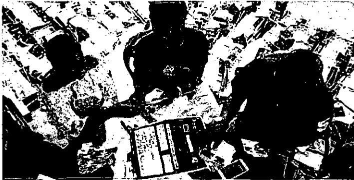
Amid an internet blackout, Congo delays election results Just over half the votes have been counted, says the electoral commission. Voters smell a rat economist.com

It has been difficult to get reliable information in Congo. The internet and text-message services have been turned off across the country