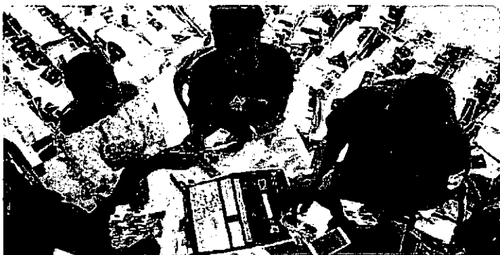
Amid an internet blackout, Congo delays election results Just over half the votes have been counted, says the electoral commission. Voters smell a rat economist.com

It has been difficult to get reliable information in Congo. The internet and text-message services have been turned off across the country