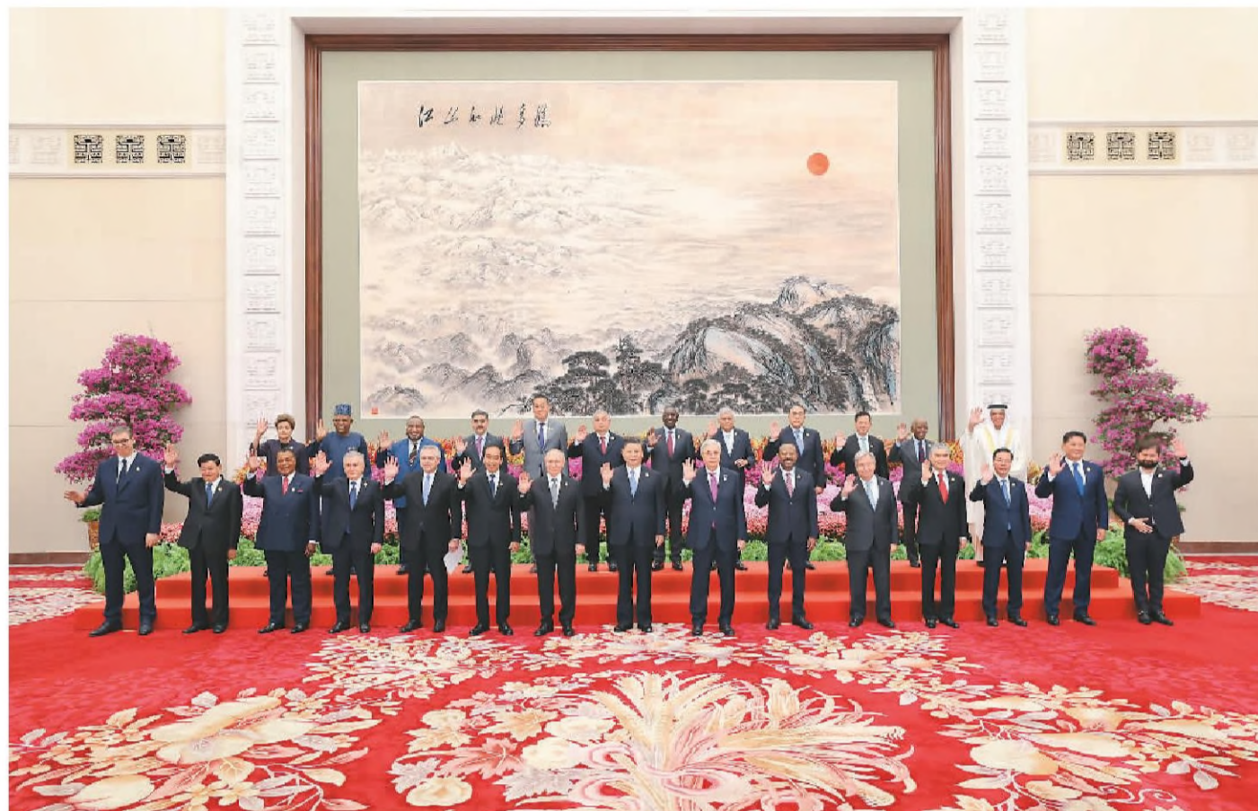
10月18日上午,国家主席习近平在北京人民大会堂出席第三届“一带一路”国际合作高峰论坛开幕式并发表题为《建设开放包容、互联互通、共同发展的世界》的主旨演讲。这是会前,习近平同出席高峰论坛的外国国家元首、政府首脑和国际组织负责人等国际贵宾集体合影。