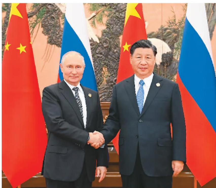
10月18日中午,国家主席习近平在北京人民大会堂同来华出席第三届“一带一路”国际合作高峰论坛的俄罗斯总统普京举行会谈。

习近平强调,发展永久睦邻友好、全面战略协作、互利合作共赢的中俄关系不是权宜之计,而是长远之计。明年是中俄建交75周年。中方愿同俄方一道,准确把握历史大势,立足两国人民根本利益,不断为中蒙俄经济走廊建设注入更多动能,支持俄罗斯人民走自主选择的民族复兴道路,维护国家主权、安全、发展利益。双方要推动中蒙俄务实合作高质量发展,积极开拓战略性新兴产业合作,以2024—2025年中俄文化