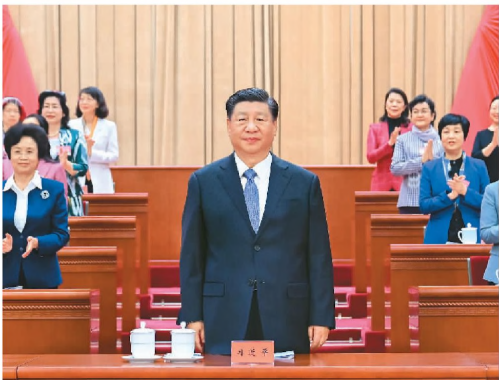
10月23日,中国妇女第十三次全国代表大会在北京人民大会堂开幕。这是中共中央总书记、国家主席、中央军委主席习近平在主席台向与会代表致意。