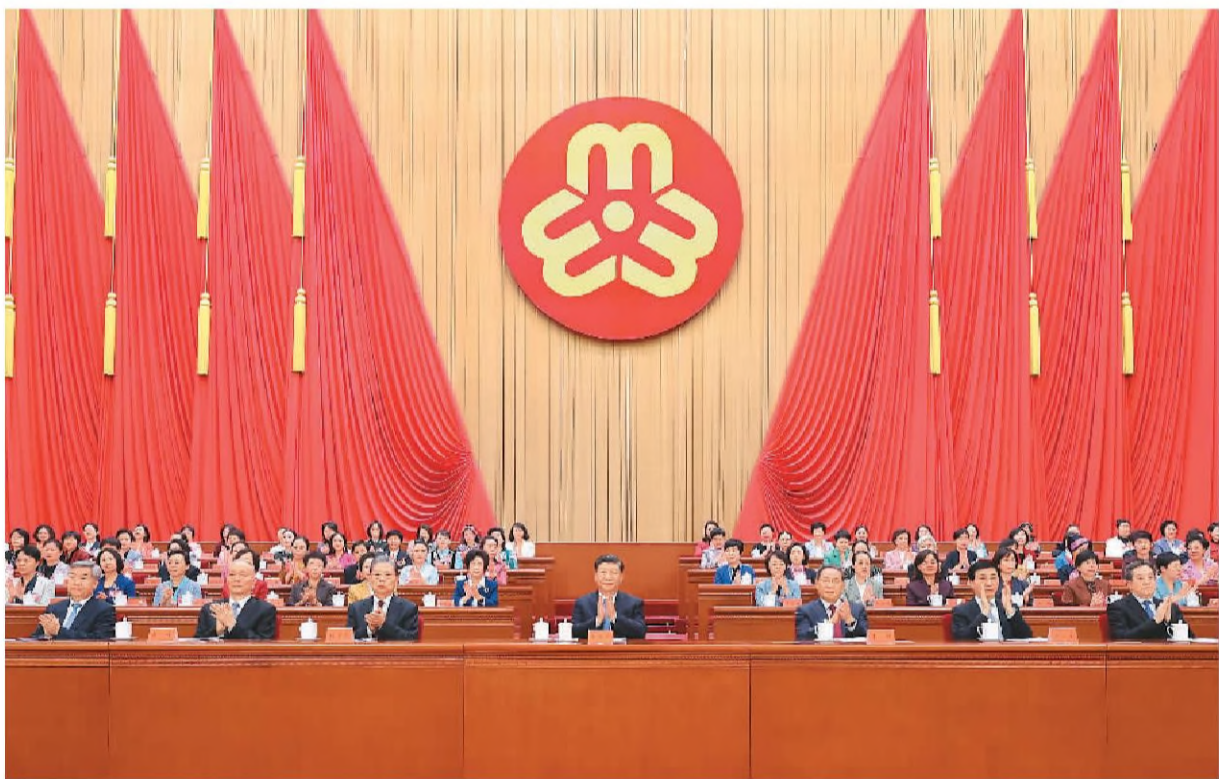
10月23日,中国妇女第十三次全国代表大会在北京人民大会堂开幕。习近平、李强、赵乐际、王沪宁、蔡奇、丁薛祥、李希等在主席台就座,祝贺大会召开。

本报北京10月23日电(记者李昌禹)中国妇女第十三次全国代表大会23日上午在人民大会堂开幕。习近平、李强、赵乐际、王沪宁、蔡奇、李希等党和国家领导人到会祝贺,丁薛祥代表党中央致词。人民大会堂大礼堂气氛庄重热烈。主席台上方悬挂着“中国妇女第十三次全国代表大会”会标,后幕正中是鲜艳的中华全国妇女联合会会徽,10面红旗分列两侧。二楼眺台悬挂着“以习近平新时代中国特色社会主义思想为指导,全面贯彻党的二十大精神,动员引领各族各界妇女为全面建设社会主义现代化国家、全面推进中华民族伟大复兴而团结奋斗!”巨型横幅。近1800名来自全国各行各业的