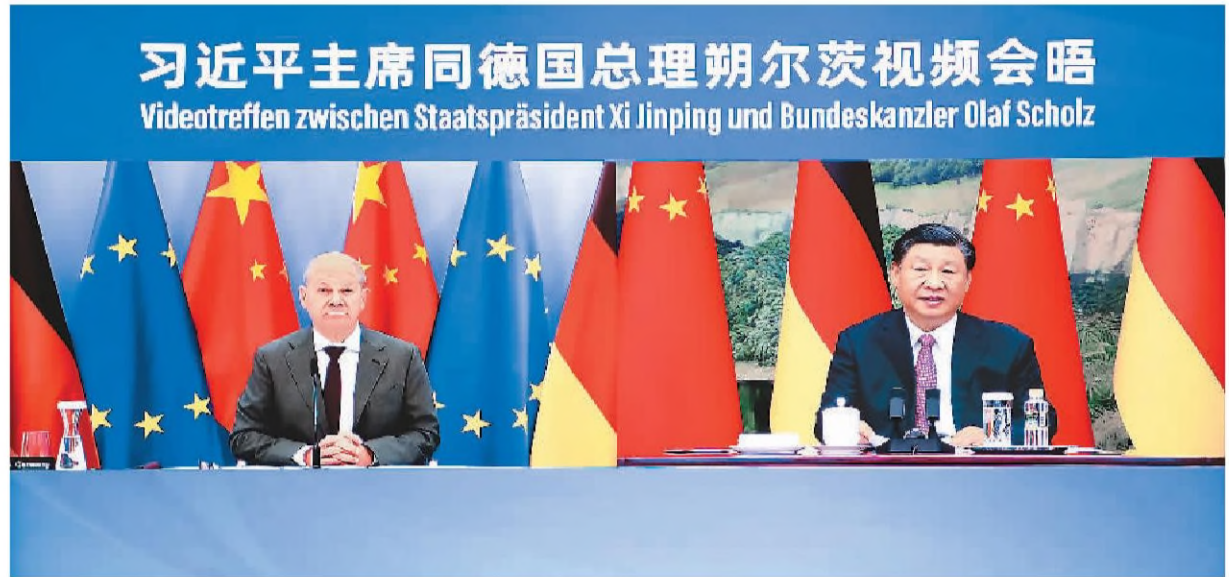
11月3日下午, 国家主席习近平同德国总理朔尔茨举行视频会晤。

新华社北京11月3日电 (记者杨依军) 11月3日下午, 国家主席习近平同德国总理朔尔茨举行视频会晤。