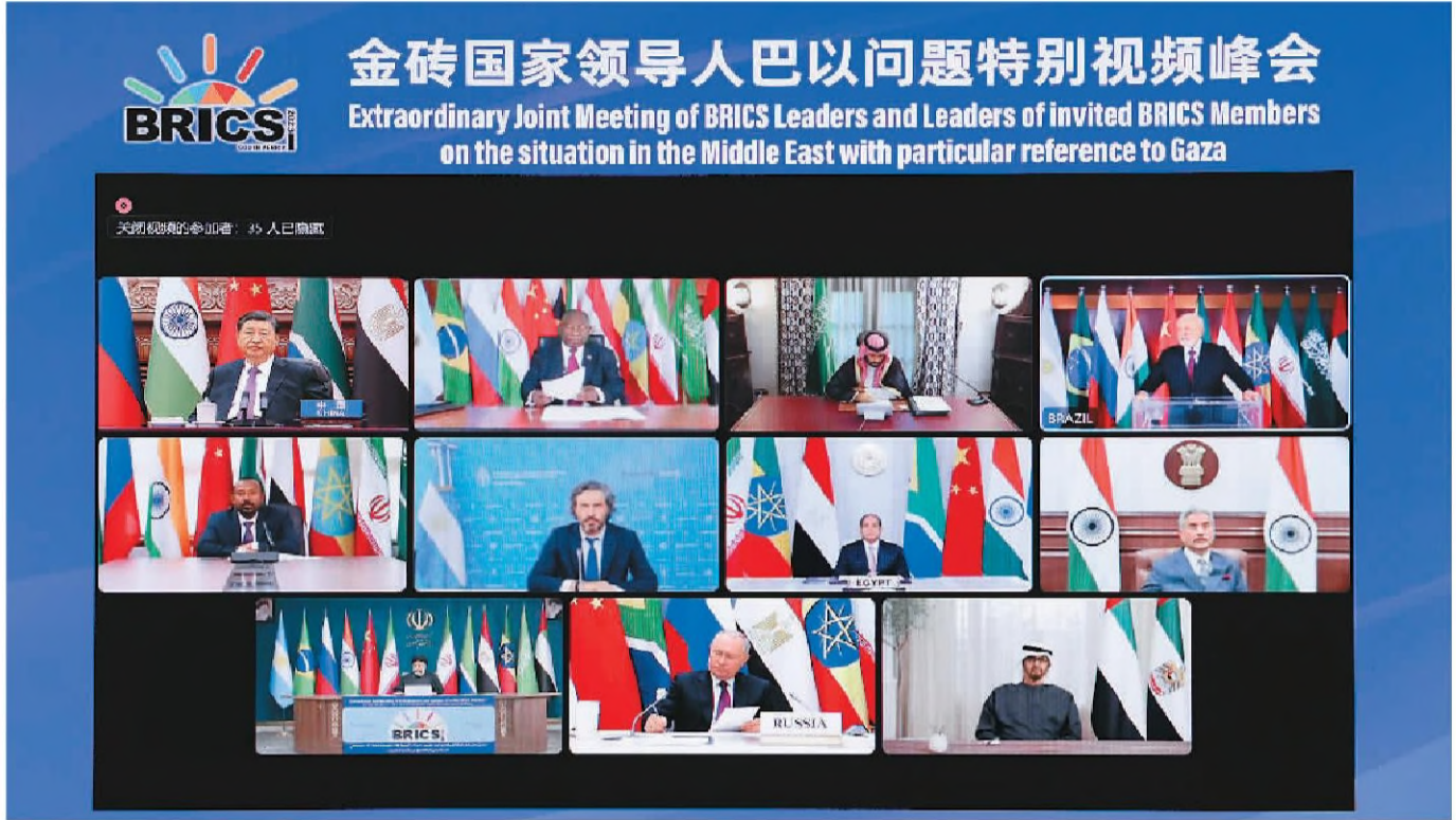
11月21日晚, 国家主席习近平出席金砖国家领导人巴以问题特别视频峰会并发表题为《推动停火止战 实现持久和平安全》的重要讲话。

新华社北京11月21日电 11月21日晚, 国家主席习近平出席金砖国家领导人巴以问题特别视频峰会并发表题为《推动停火止战 实现持久和平安全》的重要讲话。(讲话全文见第二版)