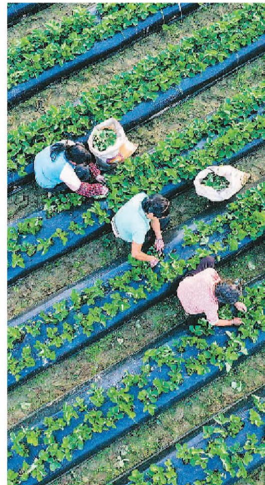
▲ 广西壮族自治区梧州市藤县藤州镇潭东村的村民为草蓐除草施肥。

子，免费发给我们，每亩还有120元补贴。大家生产积极性很高，光我家就种了200亩油菜。”据南昌市人民政府统计，全市油菜播种任务完成率已达103.38%。