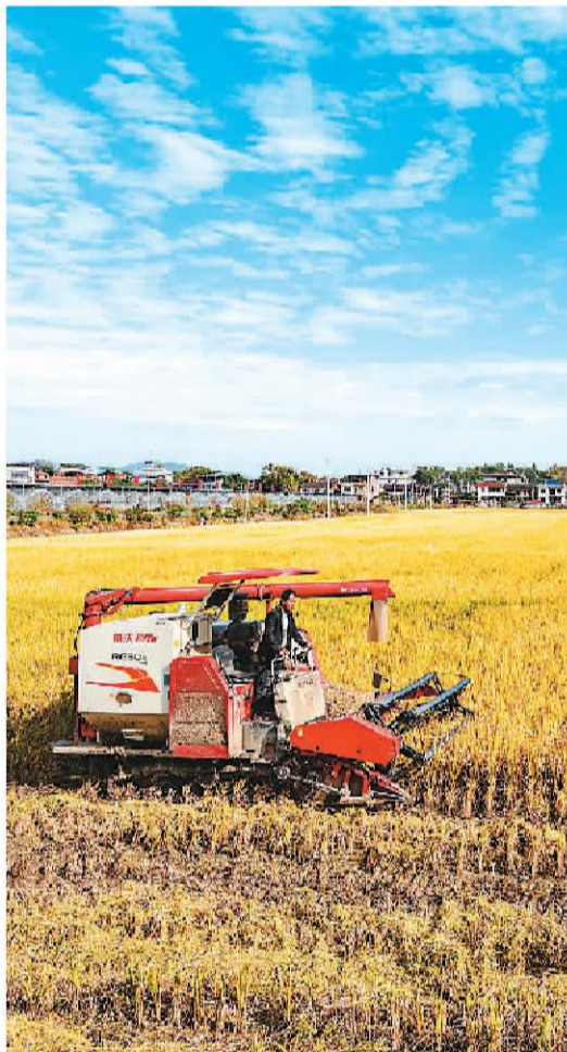
▲ 湖南省永州市东安县芦洪市镇西江桥村高标准农田开镰收割。

据农业农村部消息，目前全国秋收冬种接近尾声。近日，记者在南方部分省份了解到，多地秋粮产量提升效果较明显，粮食生产经营模式得到持续优化，粮食稳产、农民增收底气更足。农民做好秋粮收获的同时，有条不紊开展冬种生产，田间地头一派忙碌景象。