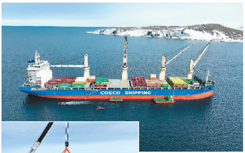
▲ 12月7日, “天惠”轮开展卸货作业。

《总体方案》要求, 上海市人民政府要强化主体责任, 建立完善制度创新机制, 扎实推进各项措施落实。国务院有关部门要给予积极支持, 对确需制定具体意见、办法、细则、方案的, 应在《总体方案》印发之日起一年内完成。商务部要组织开展成效评估, 支持上海总结成熟经验并及时复制推广。