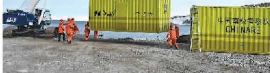
▲ 12月7日, 中国第40次南极考察队开展卸货作业。