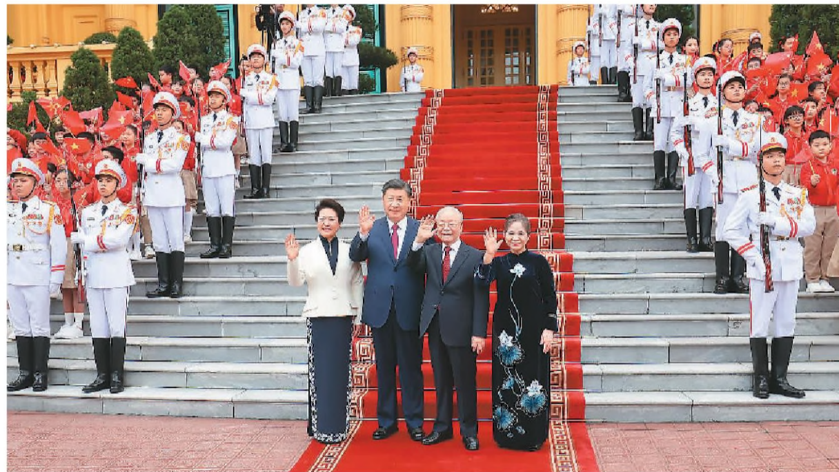
当地时间12月12日下午,刚刚抵达河内的中共中央总书记、国家主席习近平在越共中央驻地同越共中央总书记阮富仲举行会谈。这是阮富仲在主席府广场为习近平举行隆重欢迎仪式。