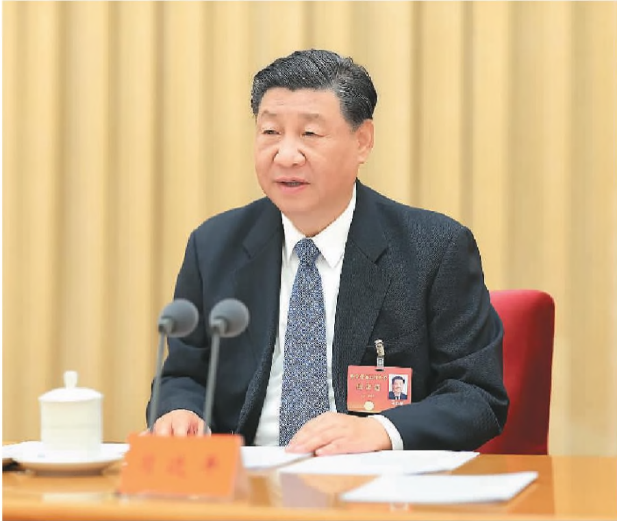
12月11日至12日,中央经济工作会议在北京举行。中共中央总书记、国家主席、中央军委主席习近平出席会议并发表重要讲话。

■做好明年经济工作,要以习近平新时代中国特色社会主义思想为指导,全面贯彻党的二十大精神,坚持稳中求进工作总基调,完整、准确、全面贯彻新发展理念,加快构建新发展格局,着力推动高质量发展,全面深化改革开放,推动高水平科技自立自强,加大宏观调控力度,统筹扩大内需和深化供给侧结构性改革,统筹新型城镇化和乡村全面振兴,统筹高质量发展和高水平安全,切实增强经济活力、防范化解风险、改善社会预期,巩固和增强经济回升向好态势,持续推动经济实现质的有效提升和量的合理增长,增进民生福祉,保持社会稳定,以中国式现代化全面推进强国建设、民族复兴伟业