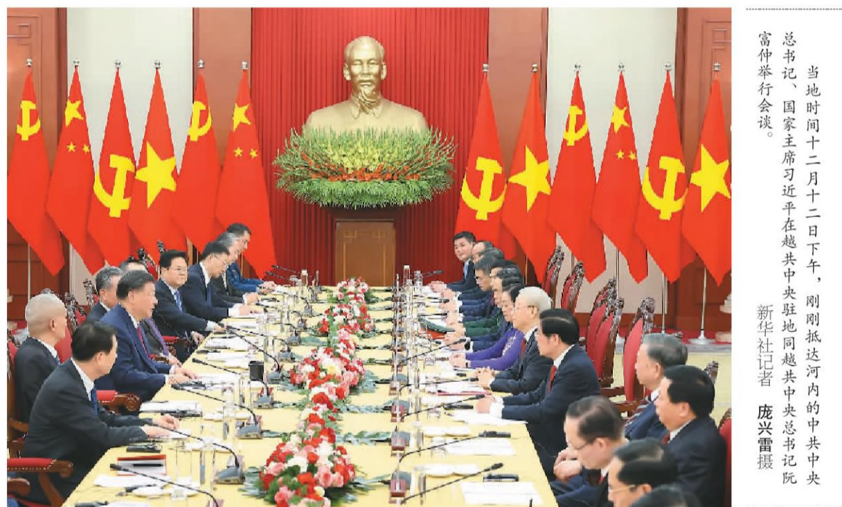
当地时间十二月十二日下午,刚刚抵达河内的中共中央总书记、国家主席习近平在越共中央驻地同越共中央总书记阮富仲举行会谈。

本报河内12月12日电(记者杜尚泽、杨学博)当地时间12月12日下午,刚刚抵达河内的中共中央总书记、国家主席习近平在越共中央驻地同越共中央总书记阮富仲举行会谈。双方宣布中越两党两国关系新定位,在深化中越全面战略合作伙伴关系基础上,携手构建具有战略意义的中越命运共同体。