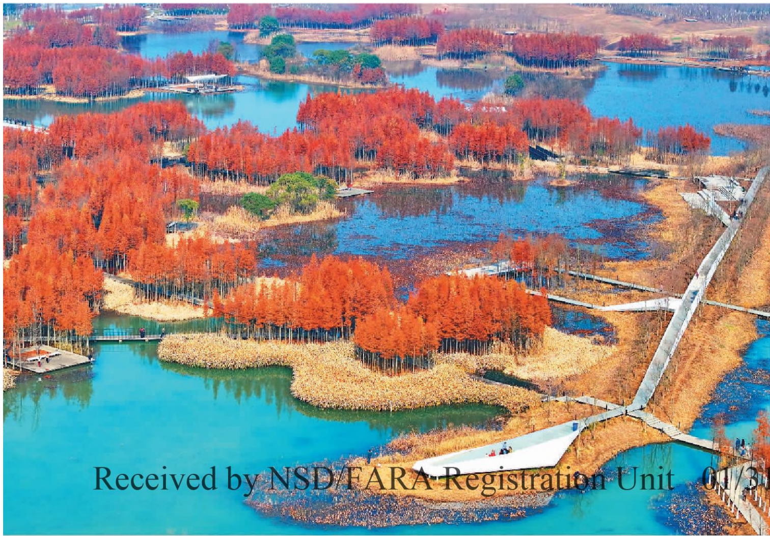
一月三日,江西省南昌市鱼尾洲湿地公园,连片的水杉如同水上漂浮的森林,栈道相互映衬,格外美丽。

行业景气水平总体向好。2023年11月,中国物流业景气指数中的业务总量指数为53.3%,环比回升0.4个百分点。行业景气水平自2023年4月以来总体呈现波动中恢复的态势,本月回升至近期较高水平,显示物流活动趋于活跃、市场发展较为稳健。