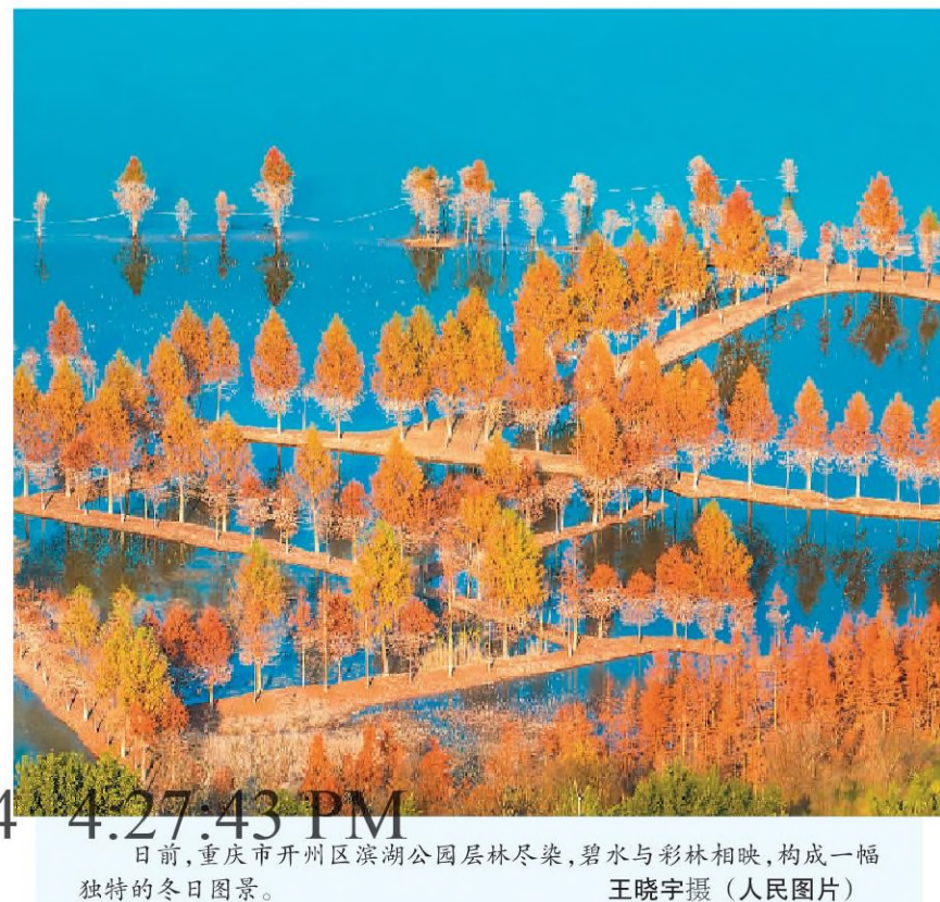
日前,重庆市开州区滨湖公园层林尽染,碧水与彩林相映,构成一幅独特的冬日图景。

布放这套生态潜标有助于更好掌握南极磷虾的季节分布特征,分析全球变暖背景下,南极主要生物种群状态及气候变化潜在影响,为南极海洋生态保护提供科学依据。中国第40次南极考察队是中国自然资源部组织,计划依托“雪龙2”号和各考察站开展一系列综合调查监测,深入研究南极在全球气候变化中的作用。