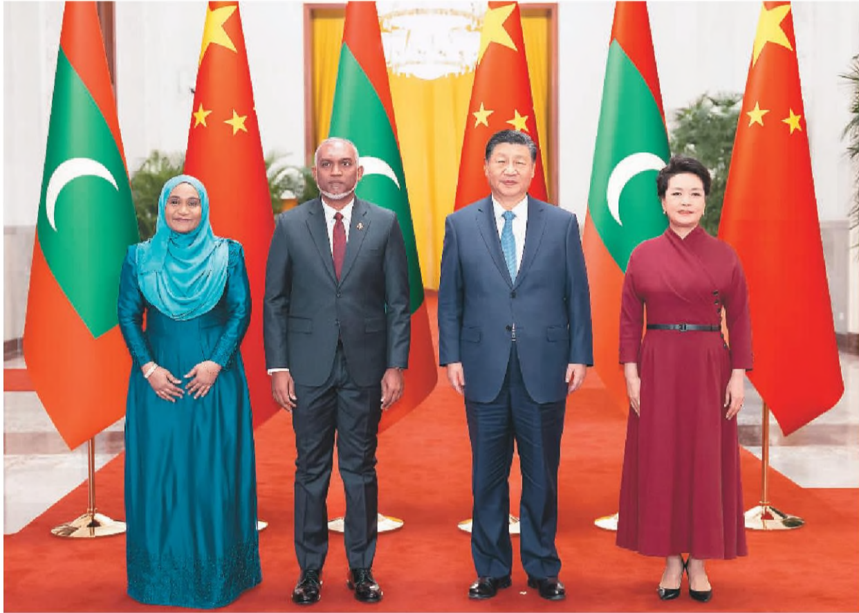
1月10日下午,国家主席习近平在北京人民大会堂同来华进行国事访问的马尔代夫总统穆伊兹举行会谈。这是会谈前,习近平和夫人彭丽媛在人民大会堂北大厅为穆伊兹和夫人萨吉达举行欢迎仪式。