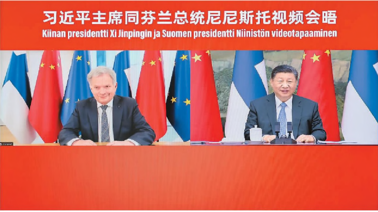
1月10日下午,国家主席习近平在北京同芬兰总统尼尼斯托举行视频会晤。