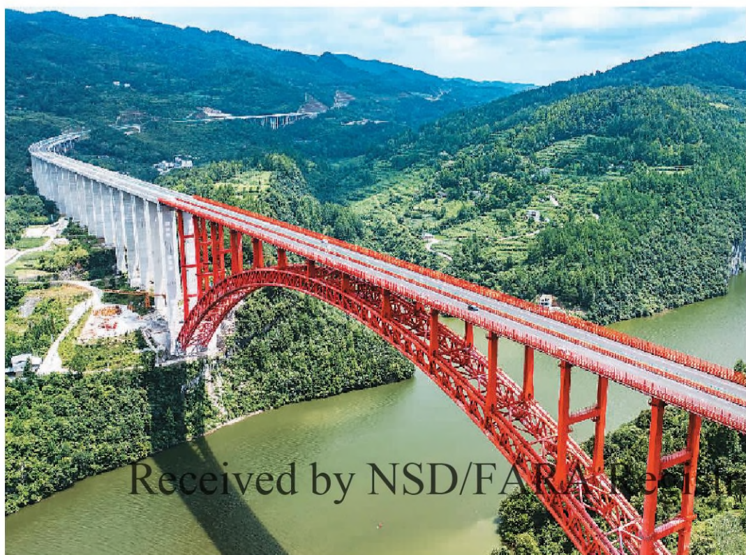
七月十日, 贵州省德江至余庆高速公路全线建成通车。德余高速公路建成通车对完善当地高速公路路网结构、推动武陵山区山区经济快速发展具有重要意义。图为当日, 车辆行驶通过德余高速公路特大桥。