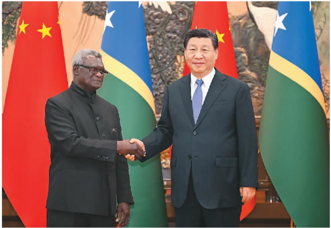
七月十日下午, 国家主席习近平在北京人民大会堂会见来华进行正式访问的所罗门群岛总理索加瓦雷。