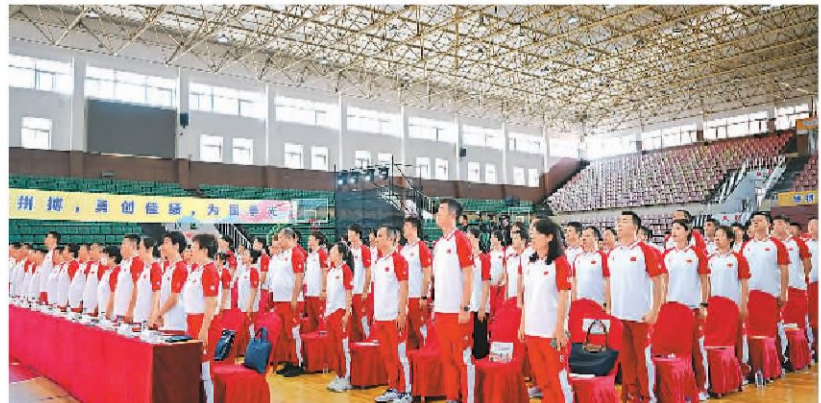
图为成都大运会中国大学生体育代表团成立大会现场。

成都大运会两度推迟,为最大限度降低疫情对学生运动员参赛的影响,国际大体联拓宽了运动员参赛资格。参赛年龄由原先的“18至25周岁”调整为“18至27周岁”,由原先的“仅限在校和毕业不超过1年的大学生参加”调整为“允许在校和2020、2021、2022三年内毕业的大学生参加”。