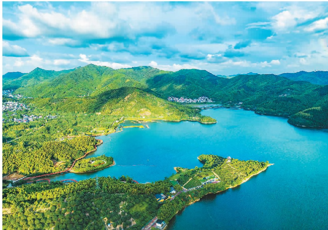
浙江省宁波市江北区慈城镇南联村充分发挥三面环山、一面临水的自然环境优势，发展乡村休闲旅游，依山傍水建设观景休闲平台、健身绿道、山地车越野公园等，增加了村民收入，助力乡村振兴。图为7月26日，山清水秀的南联村。