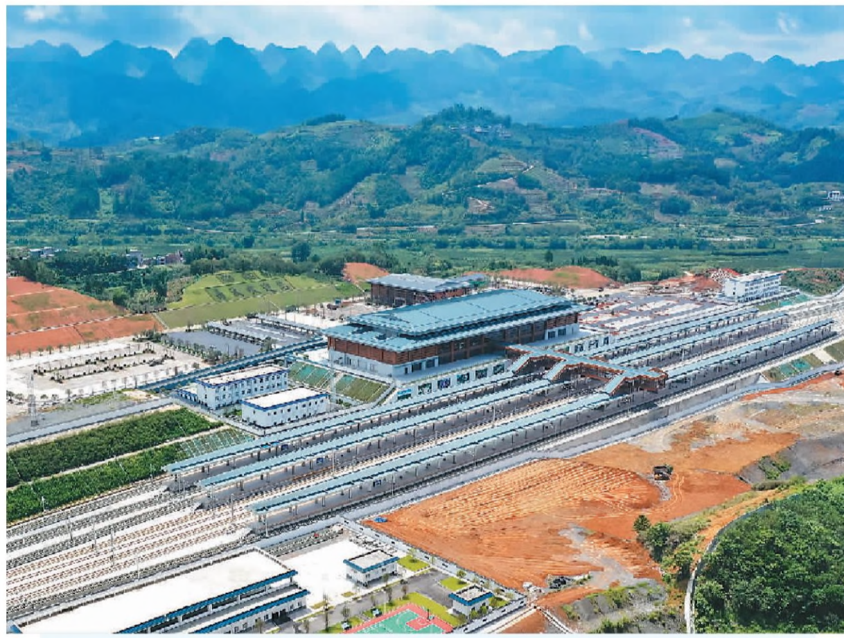
近日,贵南高铁荔波站站房整体建设完成。贵南高铁是我国“八纵八横”高速铁路网中内蒙古包头到海南海口通道的重要组成部分,也是黔桂地区首条设计时速350公里的高速铁路。贵南高铁开通后,从贵阳至南宁铁路运行时间将从现在的5个多小时缩短至2个小时左右。图为建设完成的荔波站站房及站台。新华社记者 刘续摄

2023世界机器人大会由北京市人民政府、工业和信息化部、中国科学技术协会共同主办,将于8月16日至22日在北京举行,大会主题为“开放创新 聚享未来”