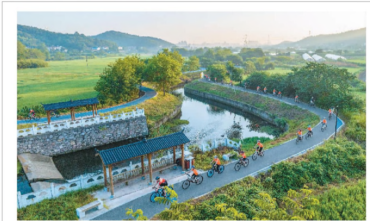
为迎接第十五个全民健身日,近日,安徽省芜湖市繁昌区人民法院组织爱好自行车运动的青年们在繁昌慢谷旅游度假区骑行锻炼。孩子们一边欣赏美景,一边享受运动的乐趣。