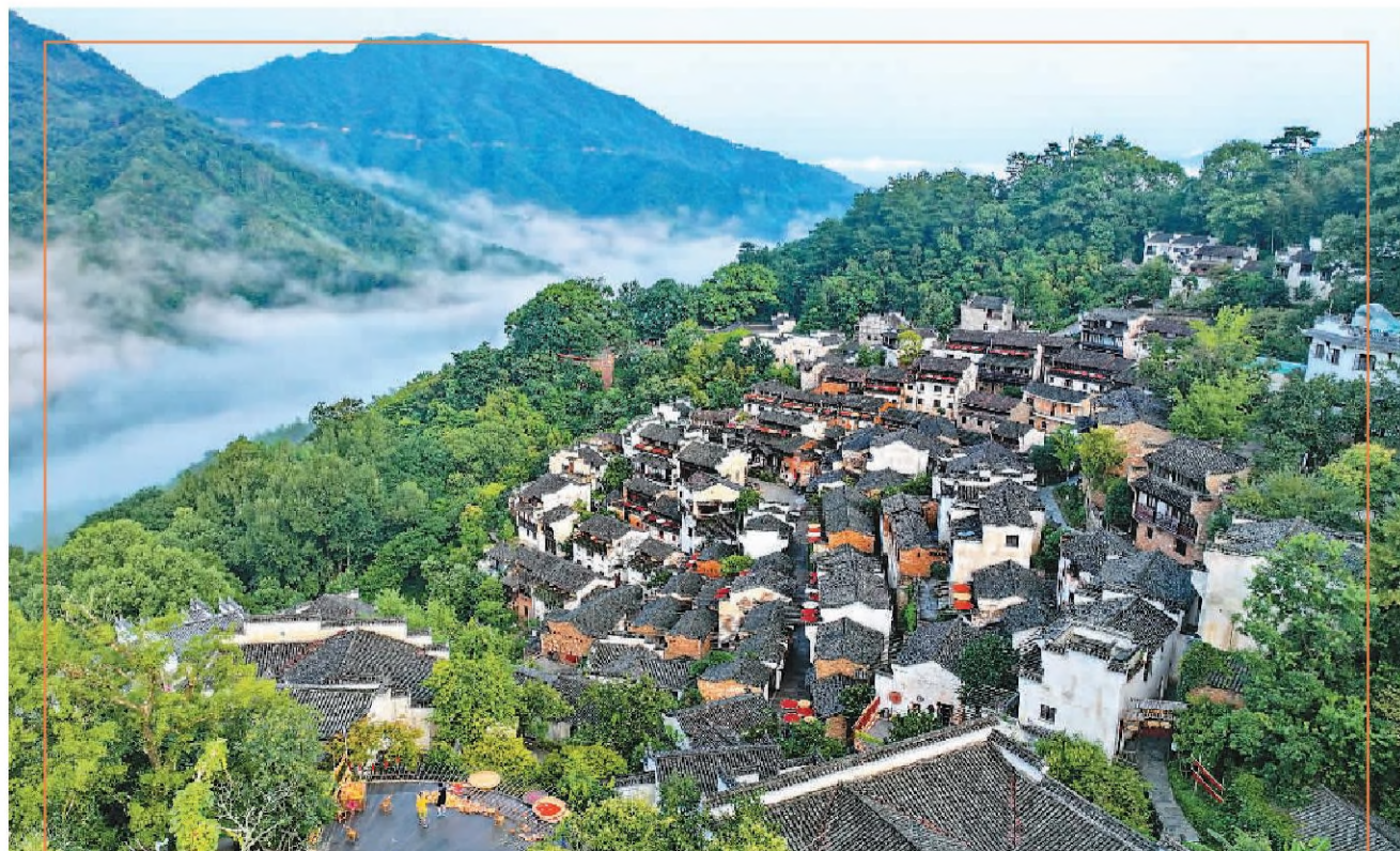
江西婺源篁岭村是典型的山区村落,上村梯田层叠,错落有致,构成了一幅一步一景一画卷。图为8月8日,篁岭村的群山绿树掩映着一栋栋徽派建筑,薄雾、霞光相映成趣,构成一幅立秋时节的乡村画卷。