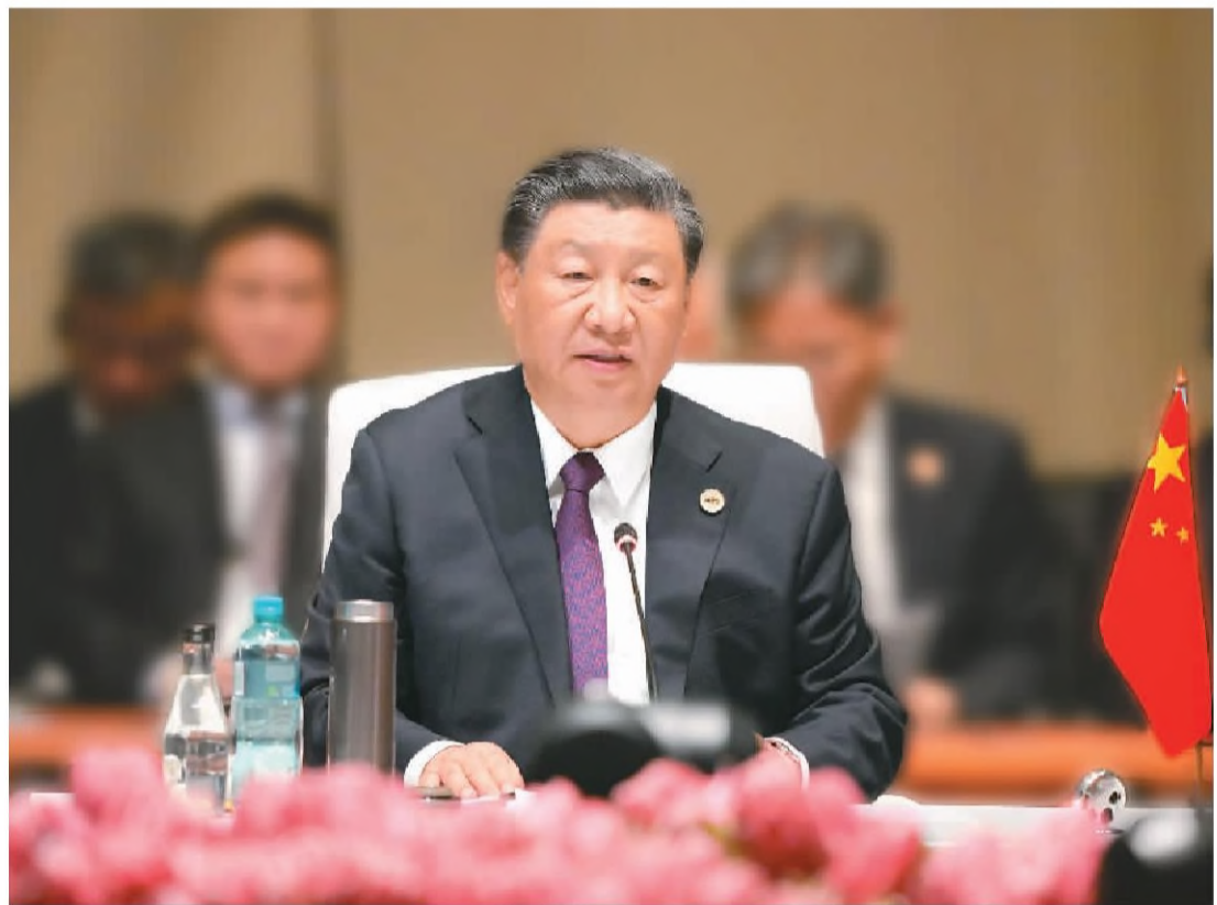
当地时间8月23日上午,金砖国家领导人第十五次会晤在约翰内斯堡杉藤会议中心举行。南非总统拉马福萨主持会晤。中国国家主席习近平、巴西总统卢拉、印度总理莫迪和俄罗斯总统普京(线上)出席。习近平发表题为《团结协作谋发展 勇于担当促和平》的重要讲话。

强调秉持开放包容、合作共赢的金砖精神,以金砖责任应对共同挑战,以金砖担当开创美好未来