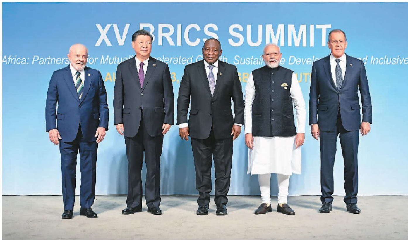
当地时间8月23日上午,金砖国家领导人第十五次会晤在约翰内斯堡杉藤会议中心举行。南非总统拉马福萨主持会晤。中国国家主席习近平、巴西总统卢拉、印度总理莫迪和俄罗斯总统普京(线上)出席。这是会晤期间,五国领导人集体合影。