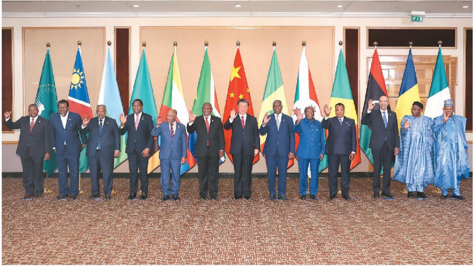
当地时间8月24日晚, 国家主席习近平和南非总统拉马福萨在约翰内斯堡共同主持中非领导人对话会。