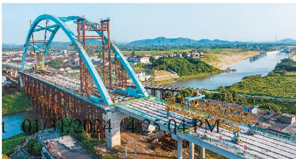
日前, 安徽省合肥巢湖市和庐江县之间的兆河上, 引江济淮工程引江济巢段沫集大桥项目主体结构全线顺利贯通, 工程线路全长1.79公里, 对推动环巢湖经济发展将起到重要作用。图为桥梁附属设施施工现场。

运输安全有序。国铁集团运输部门负责人介绍, 今年暑运, 铁路运输需求客货两旺, 学生流、旅游流、探亲流叠加。各地铁路部门加大运力投放, 强化安全管理, 提升服务品质, 全力满足人民群众出行和物流服务需求。