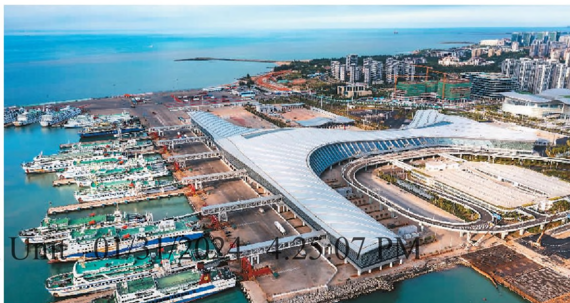
海南省海口新海港综合交通枢纽站项目日前进入收尾阶段, 计划今年交付使用。该项目建成后, 将成为俯瞰海口新海港综合交通枢纽站项目。