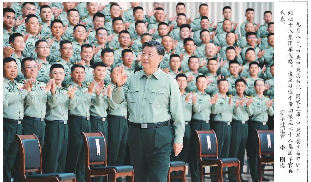
到七十八集团军视察。这是习近平亲切接见七十八集团军官兵代表。