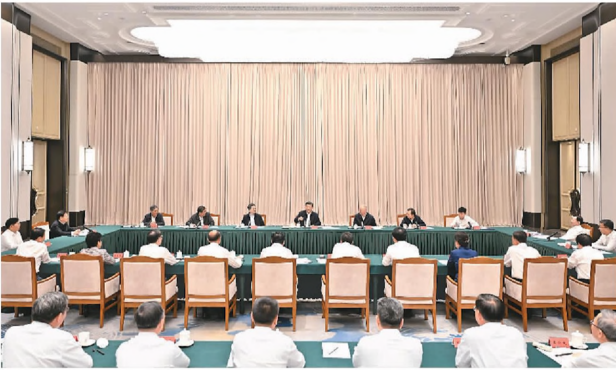
9月7日下午,中共中央总书记、国家主席、中央军委主席习近平在黑龙江省哈尔滨市主持召开新时代推动东北全面振兴座谈会并发表重要讲话。

本报哈尔滨9月9日电 中共中央总书记、国家主席、中央军委主席习近平7日下午在黑龙江省哈尔滨市主持召开新时代推动东北全面振兴座谈会并发表重要讲话。他强调,新时代新征程推动东北全面振兴,要贯彻落实党的二十大关于推动东北全面振兴实现新突破的部署,完整准确全面贯彻新发展理念,牢牢把握东北在维护国家“五大安全”中的重要使命,牢牢把握高质量发展这个首要任务和构建新发展格局这个战略任务,统筹发展和安全,坚持