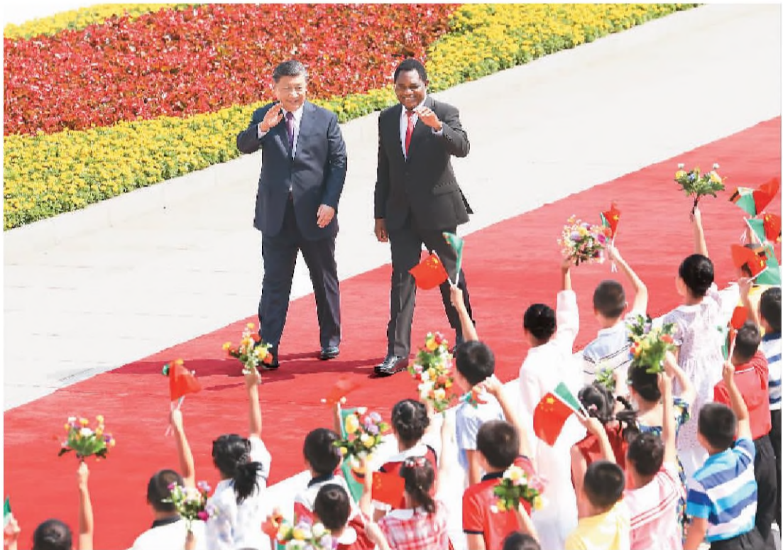
九月十五日上午,国家主席习近平在北京人民大会堂同来华进行国事访问的赞比亚总统希奇莱马举行会谈。这是会谈前习近平在人民大会堂东门外广场为希奇莱马举行欢迎仪式。

新华社北京9月15日电 (记者郑明达) 9月15日上午,国家主席习近平在人民大会堂同来华进行国事访问的赞比亚总统希奇莱马举行会谈。两国元首宣布,将中赞关系提升为全面战略合作伙伴关系。 习近平指出,中赞传统友谊由两国老一辈领导人亲手缔造,历经国际风云变幻的考验。坦赞铁路是中非友好的象征,两国人民彼此怀有特殊友好情谊。中方始终从战略高度和长远角度看待和发展中赞关系,愿同赞方一道努力,将两国深厚的传统友谊转化为新时代合作共赢的不竭动力,推动中赞关系行稳致远,不断迈上新台阶。 习近平强调,中国支持赞比亚维护国家主权、安全、发展利益,探索符合本国实际的发展道路,愿同赞方加强国际交往和治国理政经验交流,在涉及彼此核心利益和重大关切问题上坚定相互支持。中国式现代化的成功展现了世界现代化模式的多样性,中国高质量发展和现代化进程将继续为包括赞比亚在内的世界带来新机遇。中方愿同赞方一道,以共建“一带一路”为引领,拓展基础设施建设、农业、矿业、清洁能源等领域合作,共同实现发展振兴。中方鼓励更多赞比亚优质产品进入中国市场,支持更多中资企业赴赞比亚投资兴业。双方要办好明年两国建交60周年庆祝活动,加强教育培训、医疗卫生、文化旅游等领域交流合作,进一步密切人员往来,增进两国人民相知相亲。 习近平指出,当前,发展中国家群体性崛起,国际影响力不断增强,已经成为不可逆转的时代潮流。我们要加强团结协作,践行真正的多边主义,坚定维护国际公平正义,努力提升发展中国家话语权,维护两国和广大发展中国家共同利益。中非合作已经成为南南合作和国际对非合作的引领者。真诚平等、互利共赢、捍卫正义、开放包容这些中非友好的主线和底色从未改变。中国坚定支持非洲国家走独立自主的发展道路,坚定支持非洲国家成为世界政治、经济、文明发展的重要一极。中方愿同包括赞比亚在内的非洲国家一道,落实好“支持非洲工业化倡议”等中非