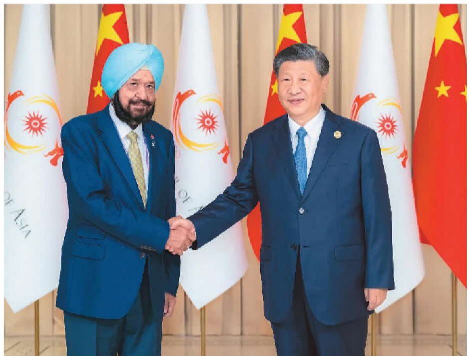
9月22日下午,国家主席习近平在杭州西湖国宾馆会见来华出席第19届亚洲运动会开幕式的亚洲奥林匹克理事会代理主席辛格。