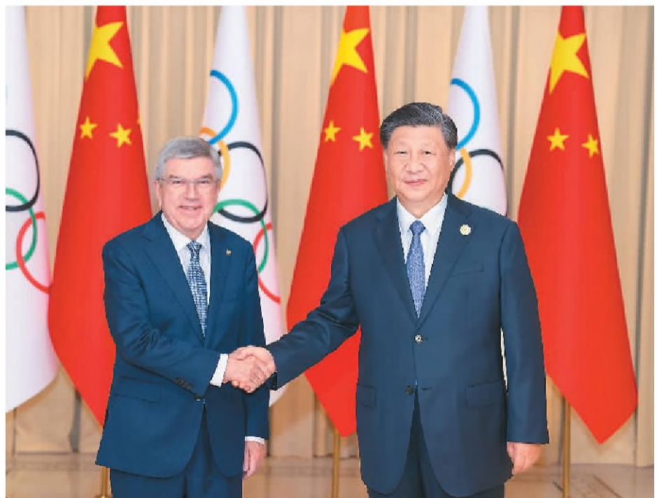
9月22日下午,国家主席习近平在杭州西湖国宾馆会见来华出席第19届亚洲运动会开幕式的国际奥林匹克委员会主席巴赫。