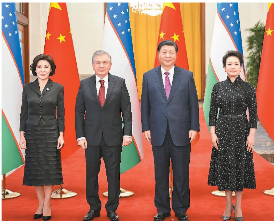
一月二十四日下午，国家主席习近平在北京人民大会堂同来华进行国事访问的乌兹别克斯坦总统米尔济约耶夫举行会谈。这是会谈前，习近平和夫人彭丽媛在人民大会堂北大厅为米尔济约耶夫和夫人米尔济约耶娃举行欢迎仪式。