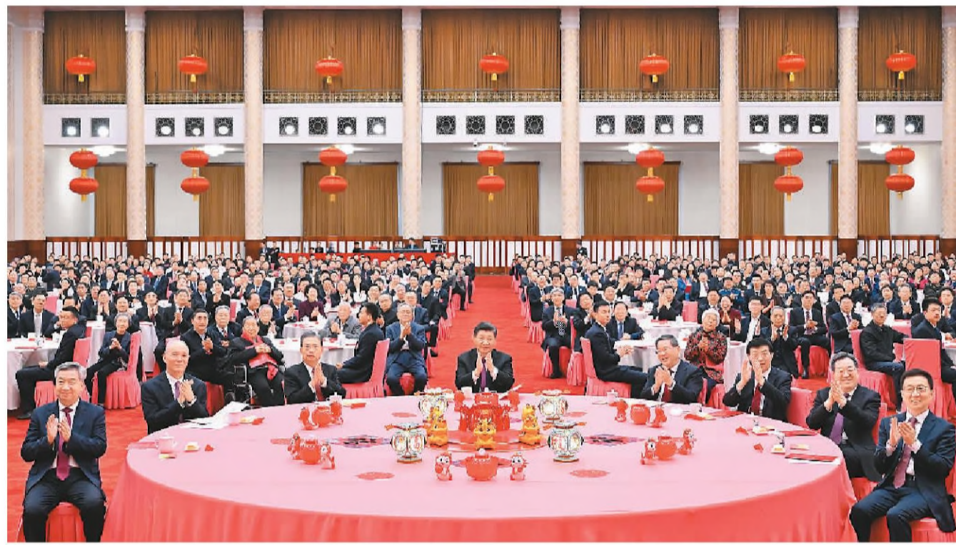
2月8日,中共中央、国务院在北京人民大会堂举行2024年春节团拜会。党和国家领导人习近平、李强、赵乐际、王沪宁、蔡奇、丁薛祥、李希、韩正等同首都各界人士齐聚一堂,共迎新春。