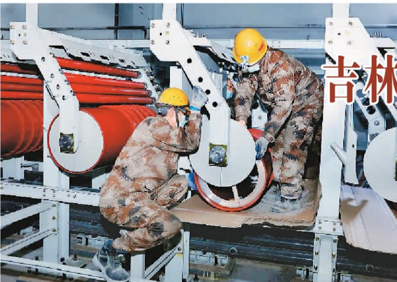
吉林化纤1万吨超细旦连续纺长丝项目现场。温月摄

在自然资源本底保护方面,示范区落实最严格的耕地保护制度,严守永久基本农田保护红线,2022年现状耕地规模与2020年相比净增2.66万亩。城镇开发边界约束作用明显,示范区将空间优化和减量提质理念贯穿规划编制实施全过程,加强空间用途管制和形态管控,截至2022年底,实现建设用地总规模净减量12.55平方公里。