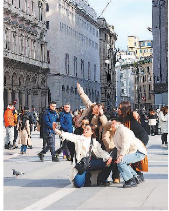
▲意大利米兰市中心,中外游客在景点前摆造型拍合影。

今年春节假期,中国游客出境旅游呈现火热景象。据中国文化和旅游部数据中心测算,春节假期出境游约360万人次。多国人士表示,中国出境游客增多,不仅有效促进国际旅游业发展,也为世界经济复苏增添动力。