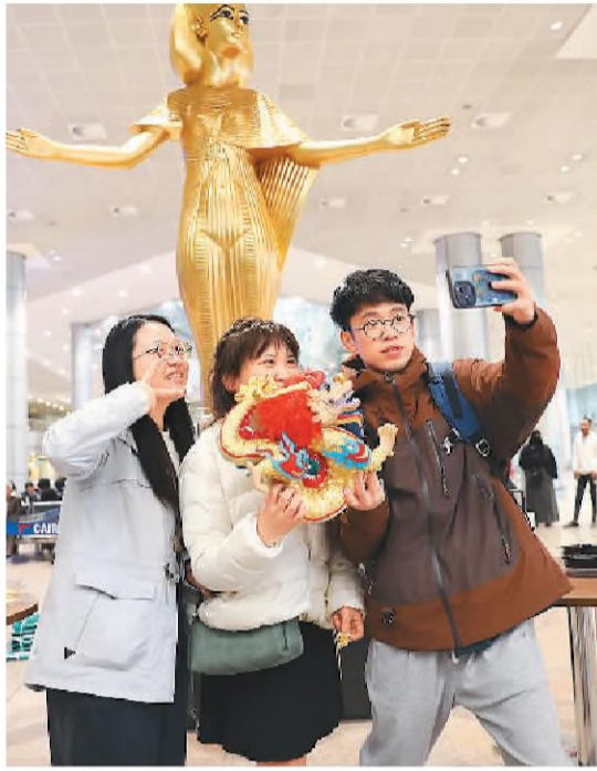
▲中国游客在埃及开罗国际机场举行的“欢迎中国游客来埃及过大年”仪式上合影。