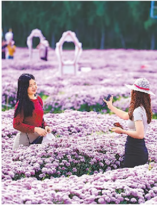
▼中国游客在泰国曼谷都会区的松树天堂阳光公园拍照打卡。