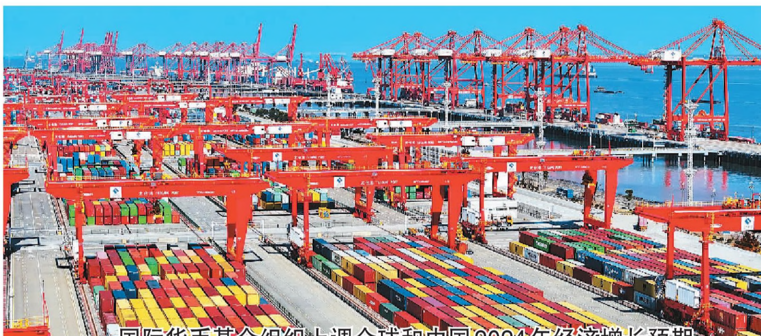
江苏省苏州港太仓港区,集装箱吞吐作业繁忙有序。