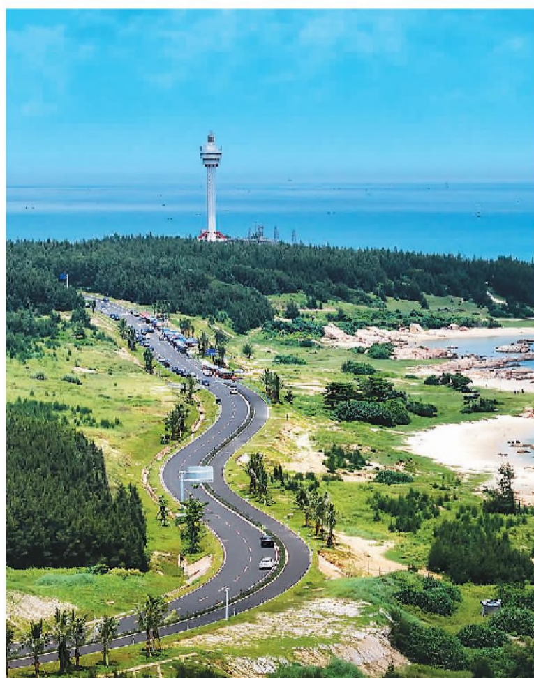
海南环岛旅游公路全长约1000公里,贯穿海南沿海12个市县,将21处风景名胜区和10处旅游名镇串联起来。自今年1月通车以来,环岛旅游公路车流涌动、客流如潮。图为海南环岛旅游公路沿线美景。

本报上海2月28日电 (记者沈文敏) 记者28日从中国船舶集团有限公司旗下上海外高桥造船有限公司获悉,国产第二艘大型邮轮建造大节点计划确定:今年4月中旬入坞开始连续搭载,2025年5月初第一次起浮,2026年3月底出坞,2026年6月开始试航,2026年底之前命名交付。 目前,该船的详细设计出图、生产设计建模及模型平衡工作已基本完成,正在重点开展背景模型、舾装安装顺序、厨房及洗衣间烟道等专项平衡,并开展重点区域模型复查,计划于今年5月实现全船技术状态的基本固化。 在国产首艘大型邮轮“爱达·魔都号”的基础上,国产第二艘大型邮轮进行了一系列优化。该船总吨位约14.2万吨,总长341米,型宽37.2米,设计吃水8.17米,最大吃水8.4米,最高航速22.7节,拥有客房2144间,比“爱达·魔都号”增加了0.67万吨,总长加长了191米,增加了19间。该船配置了高达16层的庞大上层建筑生活娱乐区域,可满足乘客更为丰富的生活和娱乐需求。