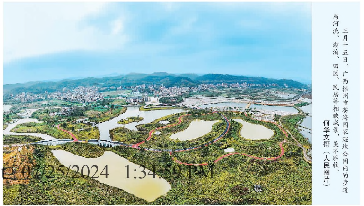
三月十五日,广西梧州市苍海国家湿地公园内的步道与河流、湖泊、田园、民居等相映成景,美不胜收。

强化河湖库管理保护。推动河湖管理范围划界,划定133万公里河流、2057个湖泊的管控边界。七大流域重要河段、重要湖泊、重要库塘全面划界实施。完成7280条河湖的健康评价,逐河逐湖建立健康档案,滚动编制实施“一河一策”方案7万多个。