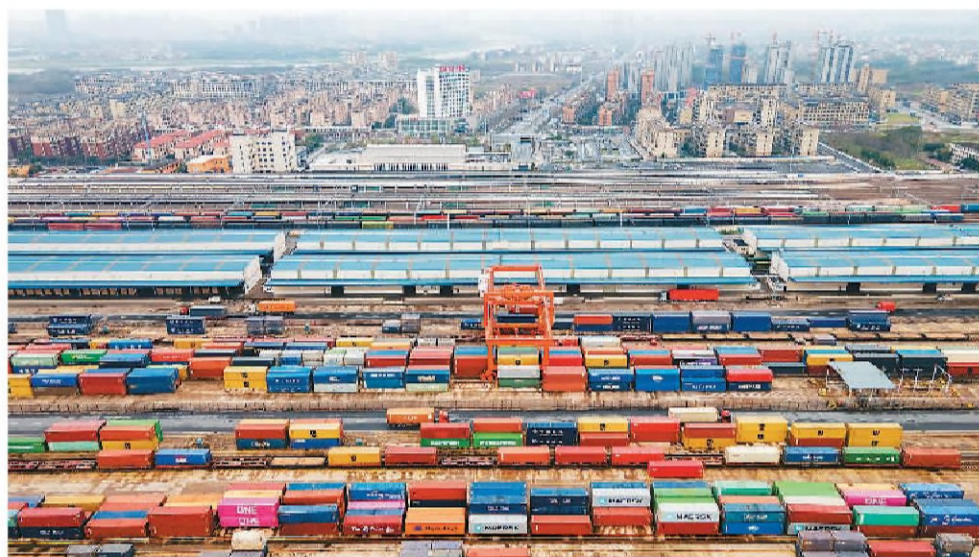
日前，浙江省金华市华东国际联运港，一列中欧班列正在铁路金华南站海关监管区进行装箱作业，准备装载110个标箱日用百货、电动工具、机械装备等货物启程驶往匈牙利布达佩斯。

有分析指出，在红海危机等地缘风险频发、全球物流和供应链遭受冲击的背景下，中欧班列的稳定器作用更加凸显。新加坡《联合早报》援引业内人士的话说，红