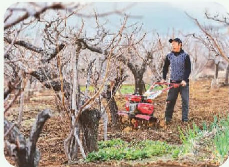
▲ 山东省青州市云门山街道朱家村农民在桃园里翻耕土地。