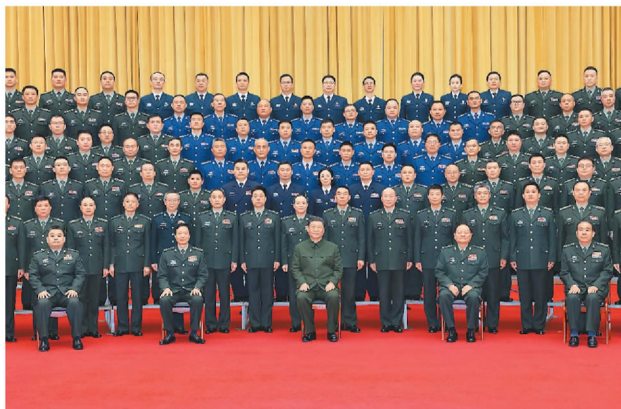
3月18日至21日,中共中央总书记、国家主席、中央军委主席习近平在湖南考察。这是20日上午,习近平在长沙亲切接见驻长沙部队上校以上领导干部,代表党中央和中央军委向驻长沙部队全体官兵致以诚挚问候。

本报长沙3月21日电 中共中央总书记、国家主席、中央军委主席习近平近日在湖南考察时强调,湖南要牢牢把握自身在构建新发展格局中的战略定位,坚持稳中求进工作总基调,坚持高质量发展不动摇,坚持改革创新、求真务实,在打造国家重要先进制造业高地、具有核心竞争力的科技创新高地、内陆地区改革开放高地上持续用力,在推动中部地区崛起和长江经济带发展中奋勇争先,奋力谱写中国式现代化湖南篇章。 3月18日至21日,习近平在湖南省委书记沈晓明和省长毛伟明陪同下,先后来到长沙、常德等地,深入学校、企业、历史文化街区、乡村等进行调研。 18日下午,习近平来到湖南第一师范学院(城南书院校区)考察。该校前身是创办于宋代的城南书院,近代以来培养了一批老无产阶级革命家和名师大家。习近平参观青年毛泽东主题展览,了解学院发展沿革和用好红色资源等情况。在学院大厅,习近平同师生代表亲切交流。他说,国家要强大,必须办好教育。一师是开展爱国主义教育、传承红色基因的好地方,要把这一红色资源保护好、利用好。学校要立德树人,教师要当好大先生,不仅要注重提高学生知识文化素养,更要上好思政课,教育引导广大青年明德知耻,树牢社会主义核心价值观,努力成长为堪当强国建设、民族复兴大任的栋梁之才。 随后,习近平来到巴斯夫杉杉电池材料有限公司考察。这是一家主营锂离子电池正极材料研发、生产和销