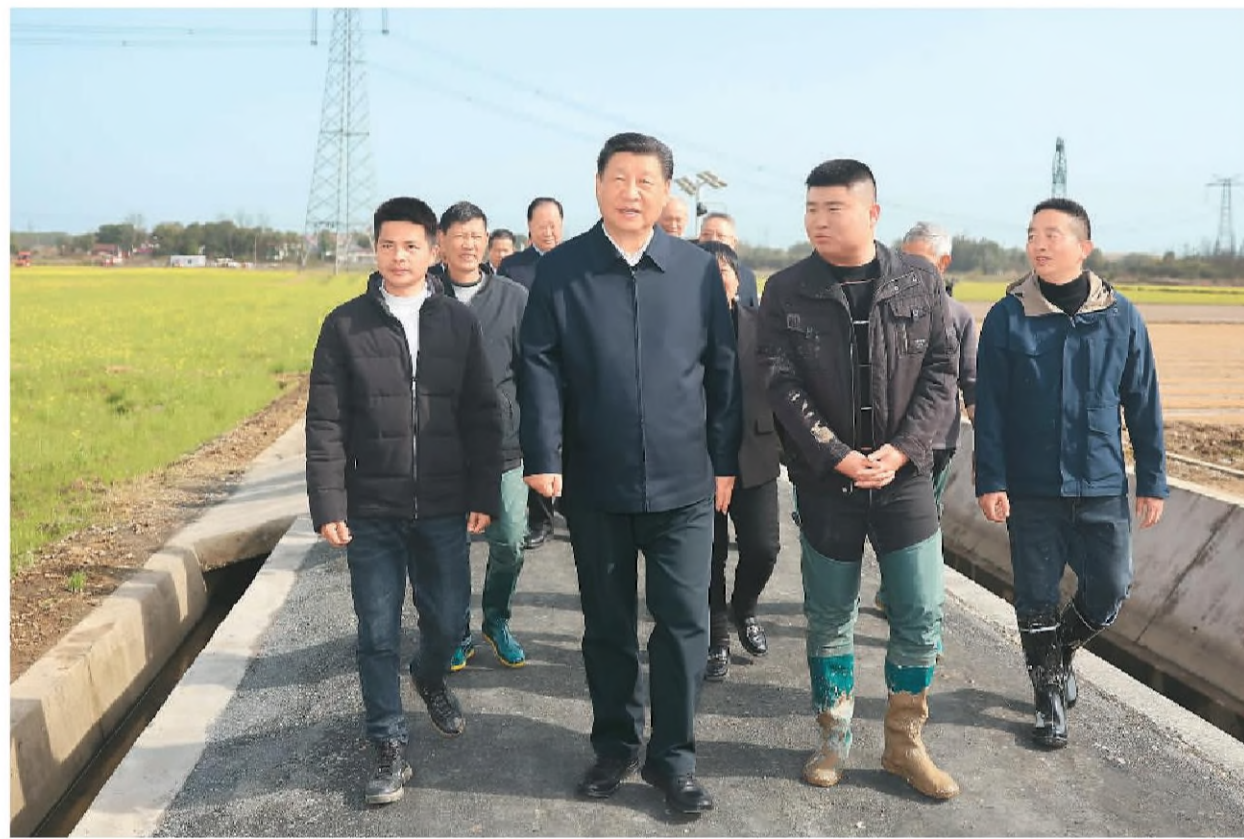
3月18日至21日,中共中央总书记、国家主席、中央军委主席习近平在湖南考察。这是19日下午,习近平在常德市鼎城区谢家铺镇港中坪村,同种粮大户、农技人员、基层干部亲切交流。