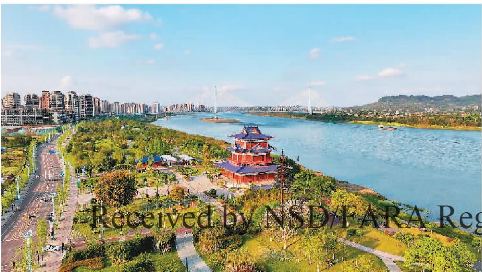
近年来,四川省宜宾市南溪区对沿长江岸线开展“净化、绿化、美化”等专项行动,让水更清、岸更绿、景更美,筑牢长江上游生态屏障。图为该区长江边的生态公园。

总书记共同推动两国全面战略合作伙伴关系迈上新台阶。巴中关系不仅对两国而且对全世界都很重要。我们将通过合作巩固联合国等全球治理传统机制,同时加强“77国集团和中国”、金砖国家和中拉论坛、“基础四国”等南南合作关键机制。巴西劳工党与中国共产党的关系是两国关系的重要组成部分。此次劳工党高级干部考察团访华并出席中国共产党和巴西劳工党第七届理论研讨会,目的是同中共开展治国理政经验交流,并就共同感兴趣的议题进行深入探讨和合作。我坚信,我们双方一定能找到更多汇合点和合作机遇。巴中两党、两国政府和两国人民之间的交流将更加密切和卓有成效。