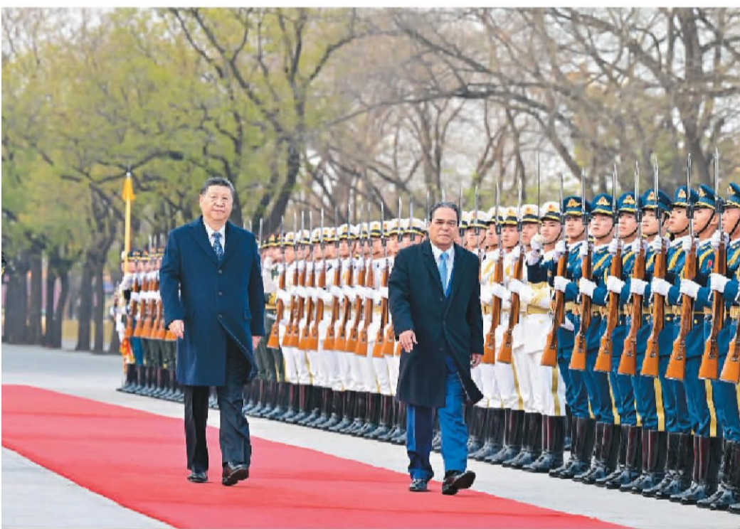
四月九日下午,国家主席习近平在北京人民大会堂东门外广场为西米纳举行欢迎仪式。