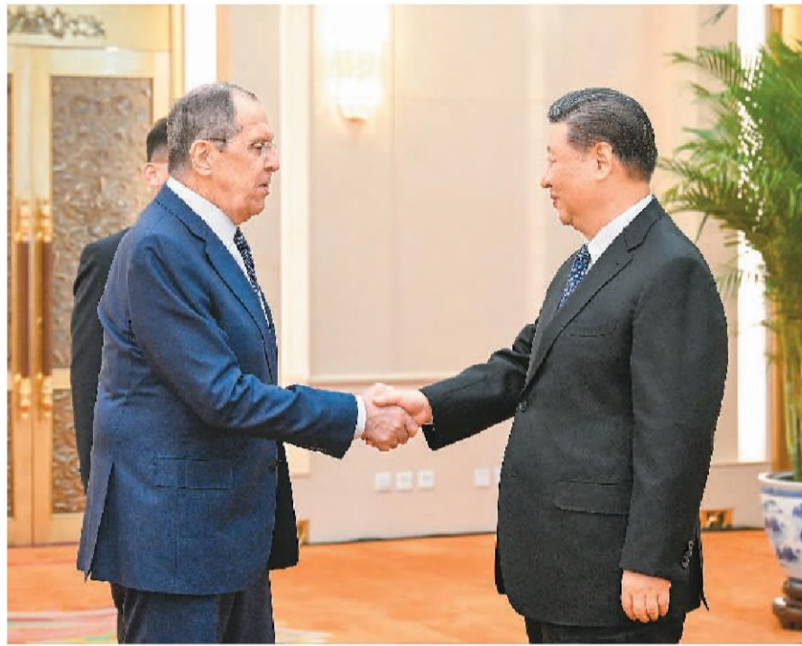
4月9日下午,国家主席习近平在北京人民大会堂会见俄罗斯外长拉夫罗夫。