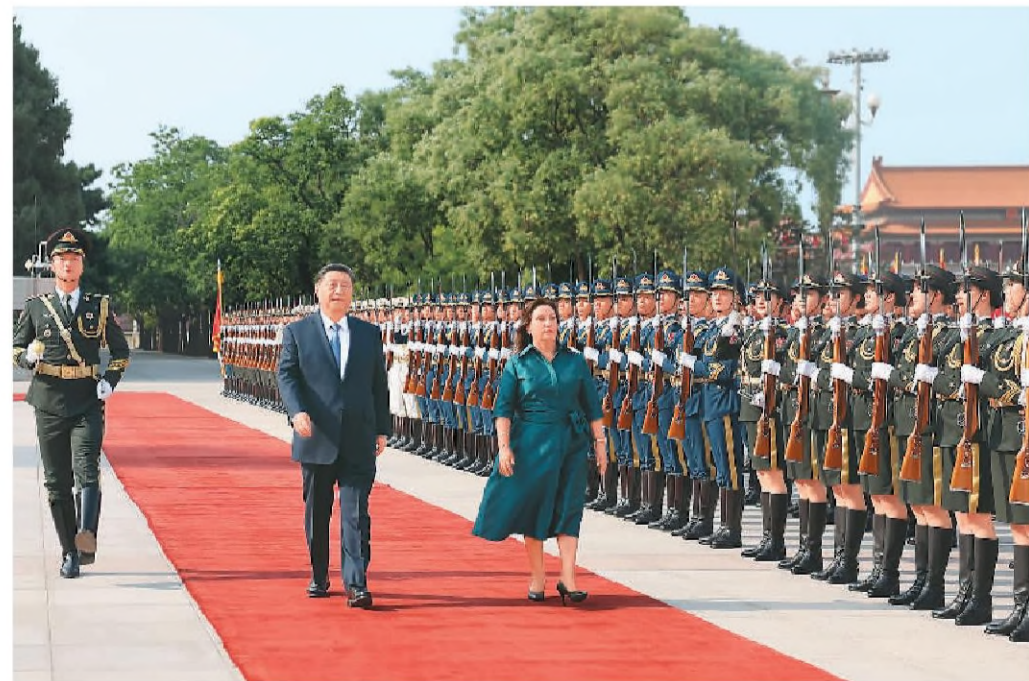
六月二十八日下午,国家主席习近平在北京人民大会堂进行国事访问的秘鲁总统博鲁阿尔特举行会谈。这是会谈前习近平在人民大会堂东门外广场为博鲁阿尔特举行欢迎仪式。

新华社北京6月28日电 (记者孙奕) 6月28日下午,国家主席习近平在北京人民大会堂同来华进行国事访问的秘鲁总统博鲁阿尔特举行会谈。 习近平指出,中国和秘鲁都是文明古国,两国友谊源远流长,人民友好深入人心。秘鲁是最早同新中国建交、最早同中国建立全面战略伙伴关系的拉美国家之一,也是最早同中国签署一揽子自由贸易协定的拉美国家。近年来,在双方共同努力下, (下转第三版)