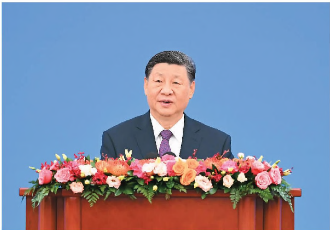
六月二十八日上午,和平共处五项原则发表70周年纪念大会在北京人民大会堂隆重举行。国家主席习近平出席纪念大会并发表题为《弘扬和平共处五项原则,携手构建人类命运共同体》的重要讲话。