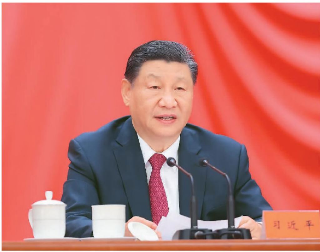
六月二十四日,全国科技大会、国家科学技术奖励大会和中国工程院第二十二次院士大会、中国科学院第十七次院士大会在北京人民大会堂隆重召开。中共中央总书记、国家主席、中央军委主席习近平出席大会并发表重要讲话。