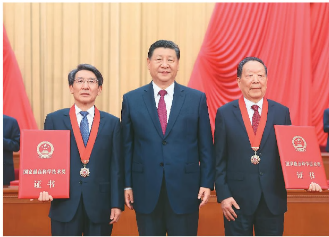
六月二十四日,全国科技大会、国家科学技术奖励大会和中国工程院第二十二次院士大会、中国科学院第十七次院士大会在北京人民大会堂隆重召开。中共中央总书记、国家主席、中央军委主席习近平向获得二〇二三年度国家最高科学技术奖的武汉大学李德仁院士(左)和清华大学薛其坤院士(右)颁奖。

党的十八大以来,党中央深入推动实施创新驱动发展战略,提出加快建设创新型国家的战略任务,不断深化科技体制改革,有力推进科技自立自强,我国基础前沿研究实现新突破,战略高技术领域迎来新跨越,创新驱动引领高质量发展取得新成效,科技体制改革打开新局面,国际开放合作取得新进展,科技事业取得历史性成就、发生历史性变革