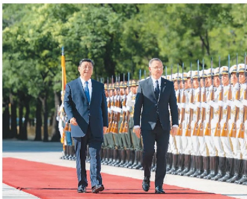
六月二十四日下午,国家主席习近平在北京人民大会堂同来华进行国事访问的波兰总统杜达举行会谈。这是会谈前,习近平在人民大会堂东门外广场为杜达举行欢迎仪式。