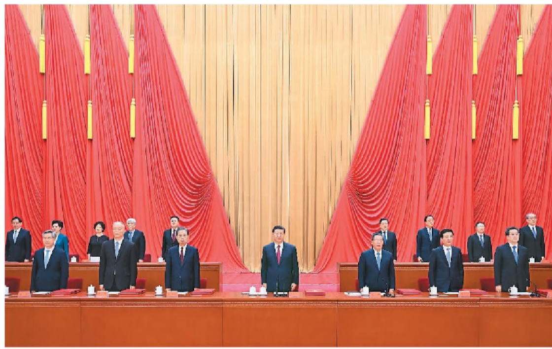
六月二十四日,全国科技大会、国家科学技术奖励大会和中国工程院第二十二次院士大会、中国科学院第十七次院士大会在北京人民大会堂隆重召开。习近平、李强、赵乐际、王沪宁、蔡奇、丁薛祥、李希等出席大会。