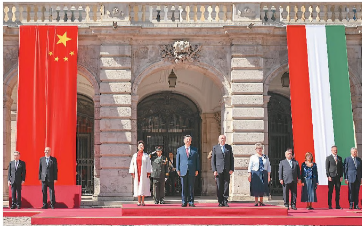
当地时间5月9日上午, 国家主席习近平在布达佩斯出席匈牙利总统舒尤克和总理欧尔班共同举行的隆重欢迎仪式。