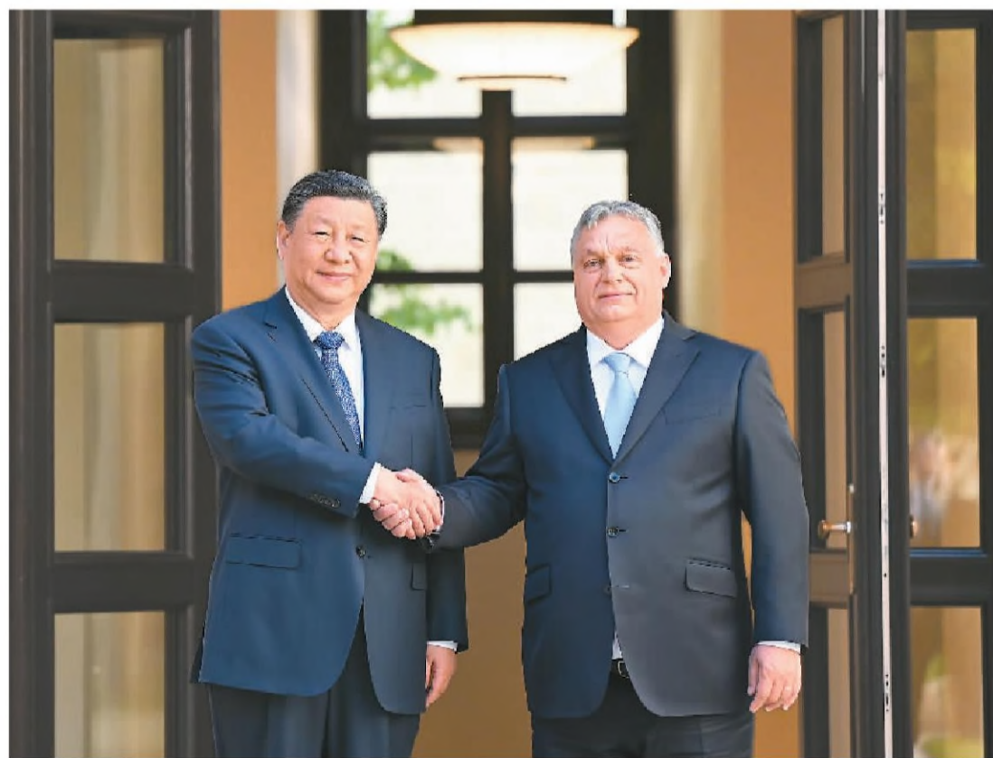
当地时间五月九日下午, 国家主席习近平在布达佩斯总理府同匈牙利总理欧尔班举行会谈。