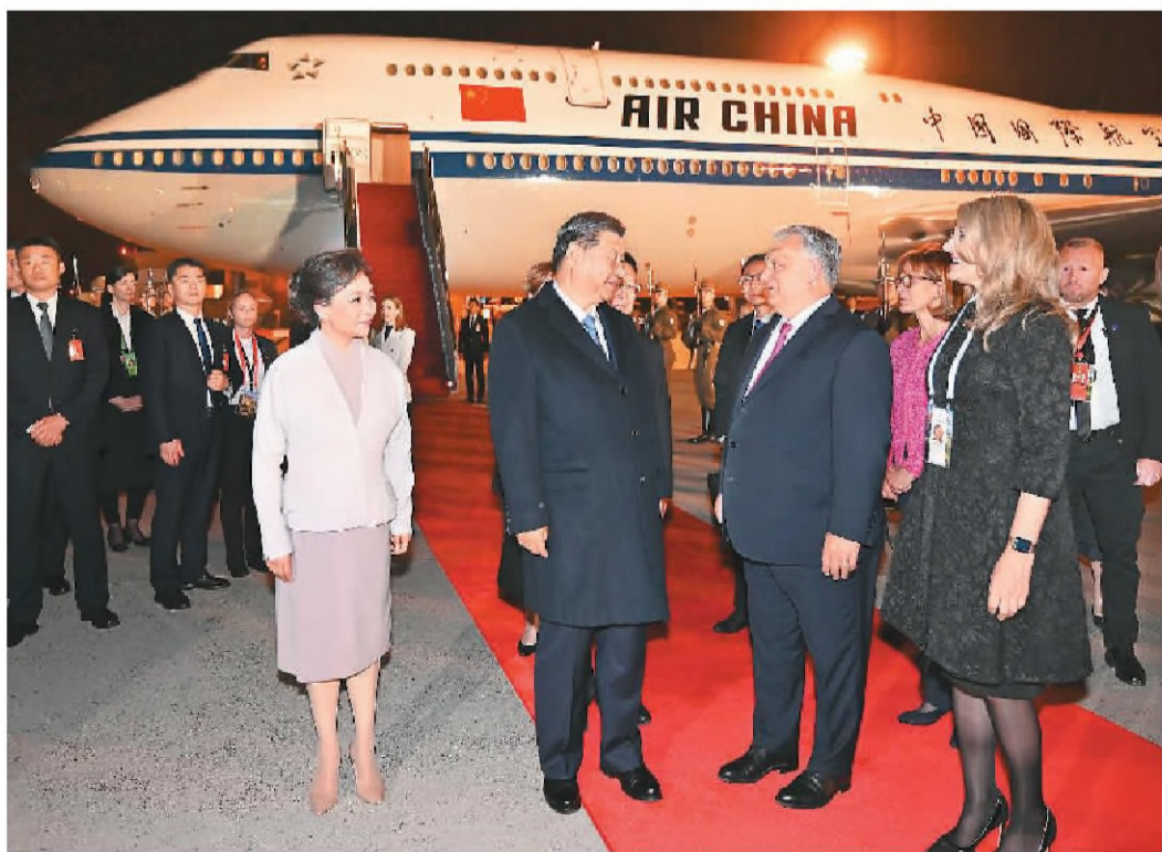
当地时间五月八日晚, 国家主席习近平乘专机抵达布达佩斯, 应匈牙利总统舒尤克和总理欧尔班邀请, 对匈牙利进行国事访问。匈牙利总理欧尔班夫妇、外长西雅尔多等政府高级官员在机场热情迎接习近平和夫人彭丽媛。