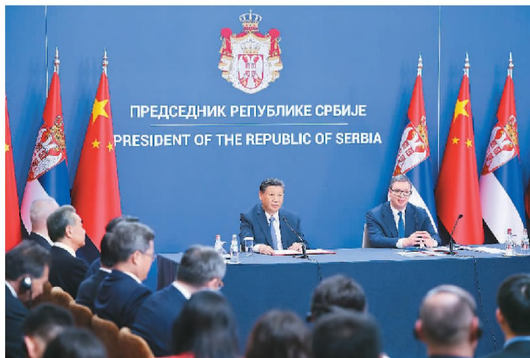
当地时间五月八日中午, 国家主席习近平在贝尔格莱德塞尔维亚大厦同塞尔维亚总统武契奇会谈后共同会见记者。