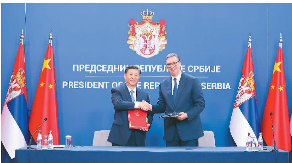
当地时间5月8日上午, 国家主席习近平在贝尔格莱德塞尔维亚大厦同塞尔维亚总统武契奇举行会谈。会谈后, 两国元首共同签署《关于深化和提升中塞全面战略伙伴关系、构建新时代中塞命运共同体联合声明》。