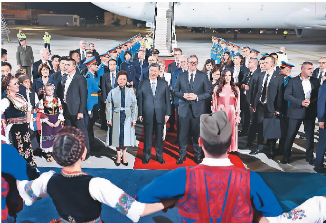
当地时间5月7日晚, 国家主席习近平乘专机抵达贝尔格莱德, 应塞尔维亚总统武契奇邀请, 对塞尔维亚进行国事访问。习近平乘专机抵达贝尔格莱德尼古拉·特斯拉国际机场时, 塞尔维亚总统武契奇夫妇, 对华合作国家委员会主席、前总统尼科利奇夫妇, 议长布尔纳比奇, 总理武切维奇和外长久里奇等热情迎接。