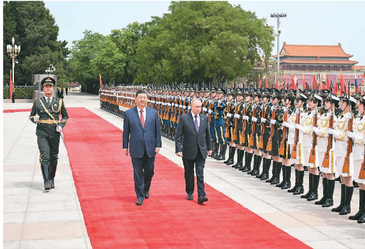
5月16日上午, 国家主席习近平在北京人民大会堂同来华进行国事访问的俄罗斯总统普京举行会谈。这是会谈前, 习近平在人民大会堂东门外广场为普京举行隆重欢迎仪式。