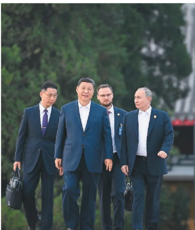
5月16日晚, 国家主席习近平在北京中南海同俄罗斯总统普京举行小范围会晤。

习近平阐述了中方一贯立场以及为推动政治解决乌克兰危机所作努力, 强调处理任何重大问题既要治标, 也要治本; 既要谋当下, 也要计长远。我提出全球安全倡议, 核心是倡导共同、综合、合作、可持续的安全观。解决乌克兰危机的根本之策是推动构建均衡、有效、可持续的新型安全架构。中方愿同各方平等参与、公平讨论所有方案的国际和会, 推动早日政治解决乌克兰问题, 愿继续为此发挥建设性作用。 (下转第四版)