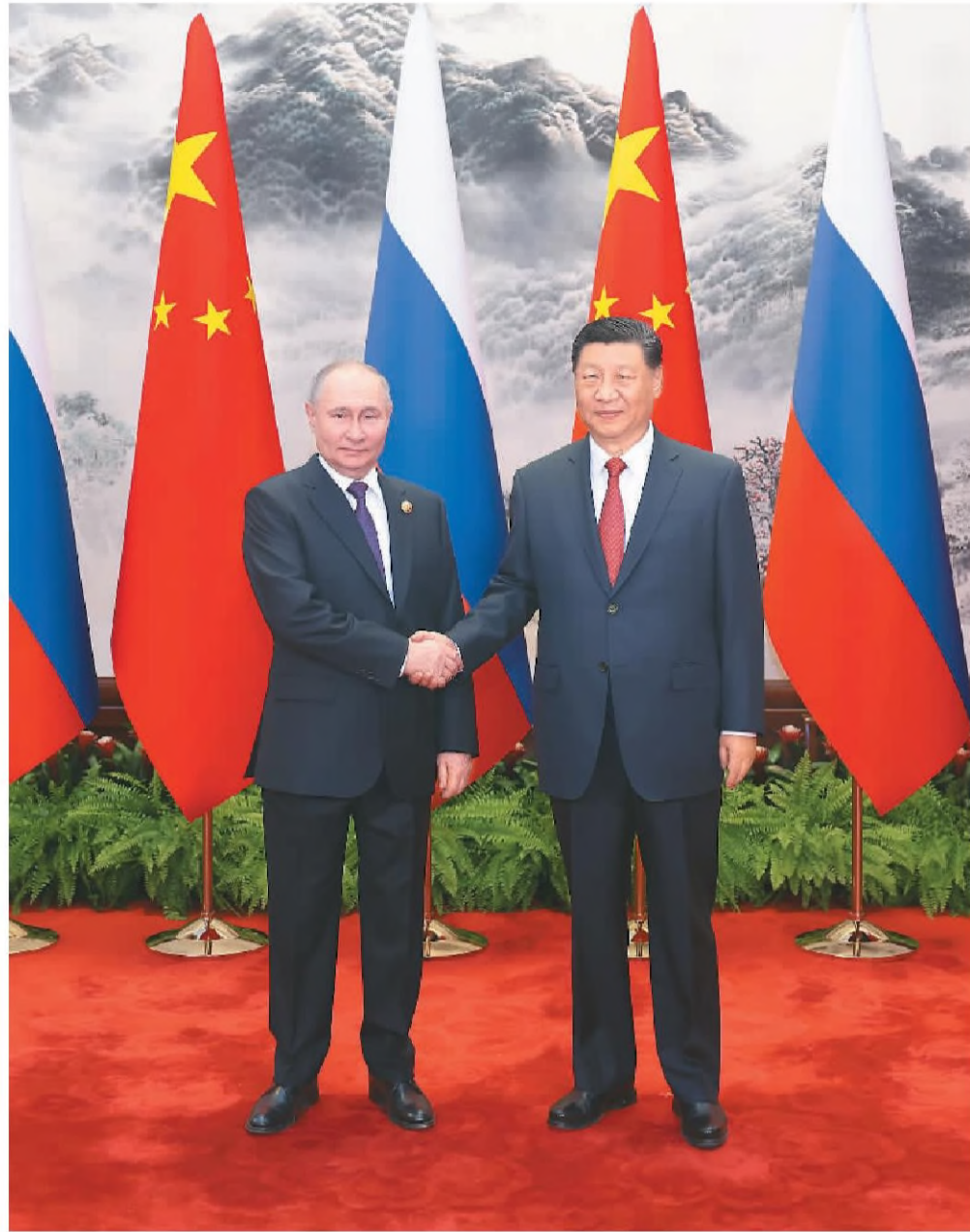
5月16日上午, 国家主席习近平在北京人民大会堂同来华进行国事访问的俄罗斯总统普京举行会谈。这是习近平同普京握手。