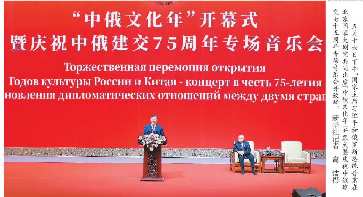
五月十六日下午, 国家主席习近平和俄罗斯总统普京在北京国家大剧院共同出席“中俄文化年”开幕式暨庆祝中俄建交75周年专场音乐会并致辞。习近平和普京在热烈的掌声中一同步入会场。 新华社北京5月16日电 (记者孙奕) 5月16日下午, 国家主席习近平和俄罗斯总统普京在北京国家大剧院共同出席“中俄文化年”开幕式