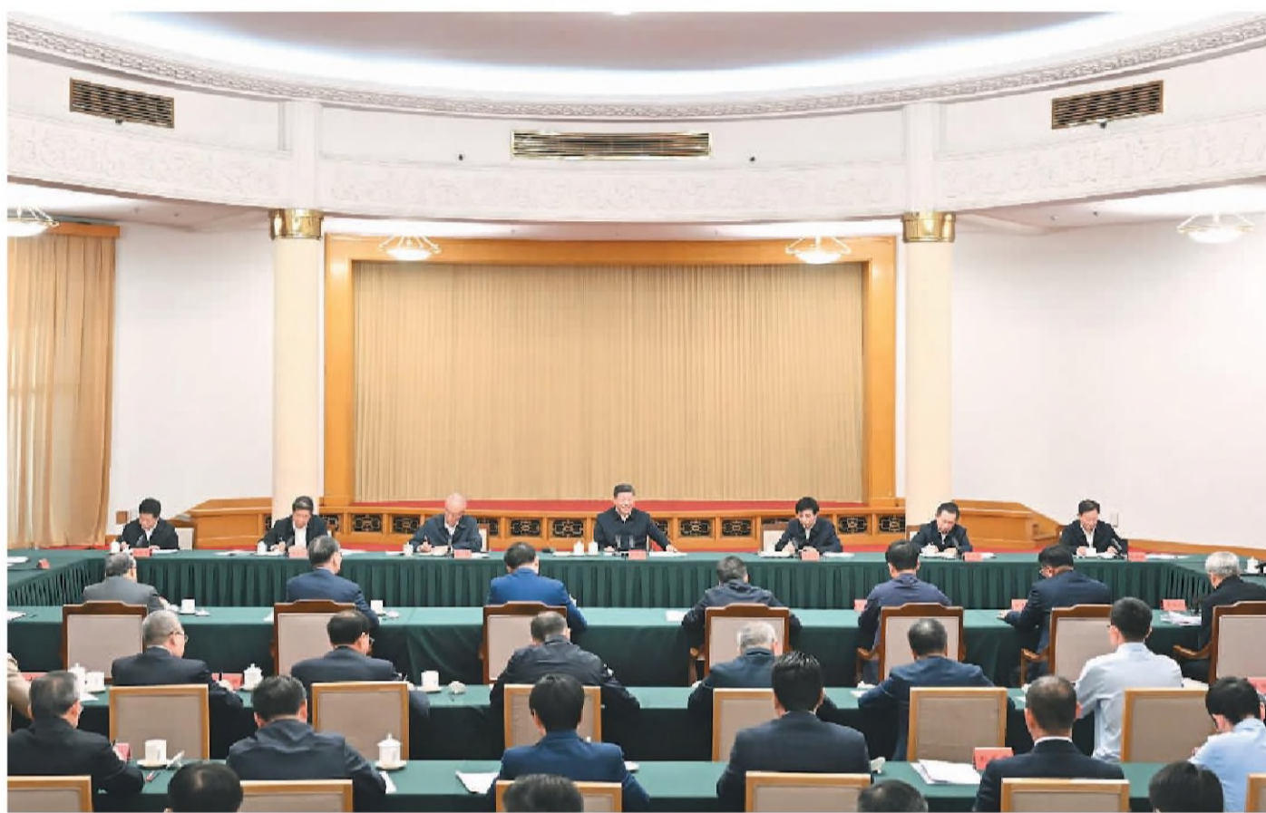
五月二十三日，中共中央总书记、国家主席、中央军委主席习近平在山东省济南市主持召开企业和专家座谈会并发表重要讲话。

习近平指出，人民对美好生活的向往就是我们的奋斗目标，抓改革、促发展，归根到底就是为了让人民过上更好的日子。要从人民的整体利益、根本利益、长远利益出发谋划和推