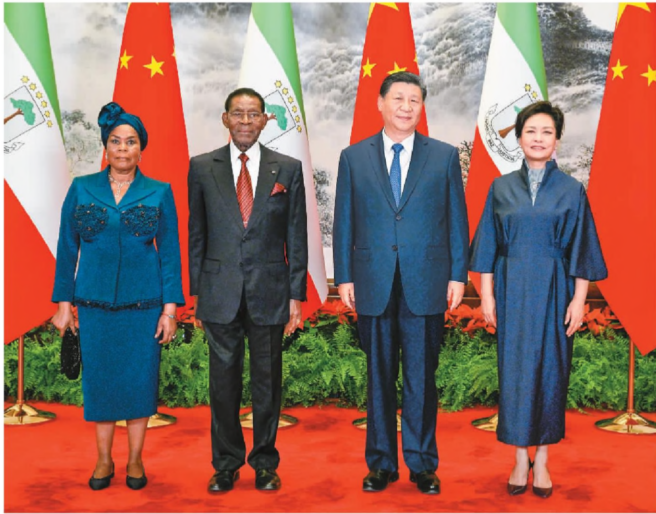
五月二十八日下午，国家主席习近平在北京人民大会堂同赤道几内亚总统奥比昂举行会谈。这是会谈前，习近平和夫人彭丽媛同奥比昂和夫人康斯坦西娅合影。