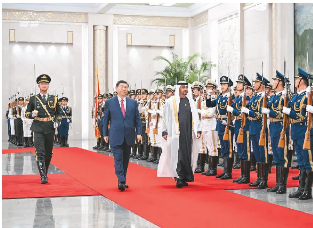
5月30日下午, 国家主席习近平在北京人民大会堂同来华国事访问并出席中国—阿拉伯国家合作论坛第十届部长级会议开幕式的阿联酋总统穆罕默德举行会谈。这是会谈前, 习近平在人民大会堂北大厅为穆罕默德举行欢迎仪式。