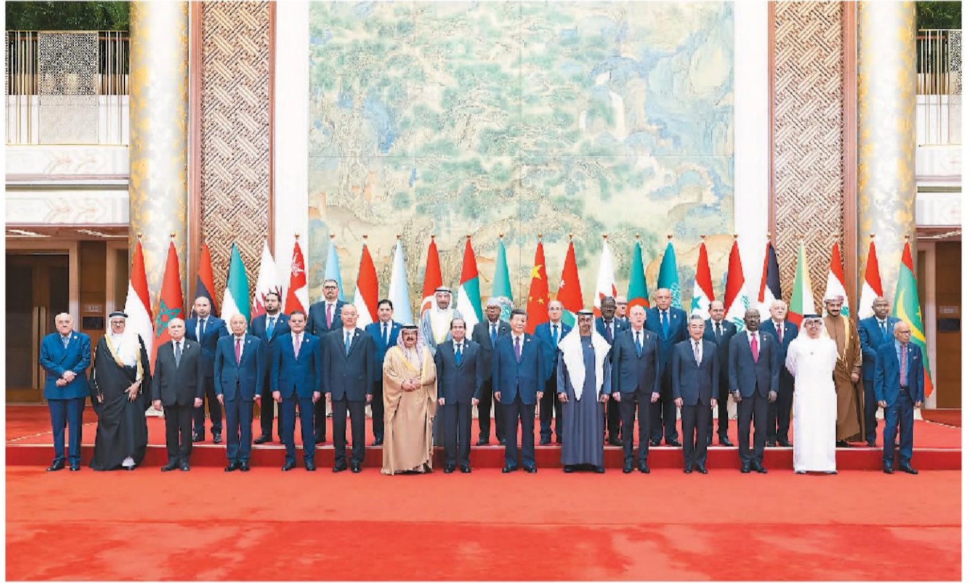
5月30日上午, 国家主席习近平在北京钓鱼台国宾馆出席中阿合作论坛第十届部长级会议开幕式并发表主旨讲话。这是习近平同巴林国王哈马德、埃及总统塞西、突尼斯总统赛义德、阿联酋总统穆罕默德、阿盟秘书长盖特以及22位阿拉伯国家代表团团长集体合影。