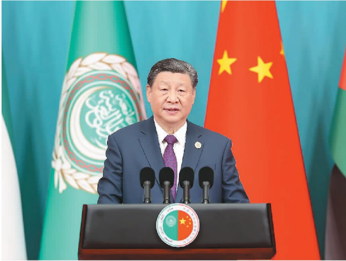
5月30日上午, 国家主席习近平在北京钓鱼台国宾馆出席中阿合作论坛第十届部长级会议开幕式并发表主旨讲话。