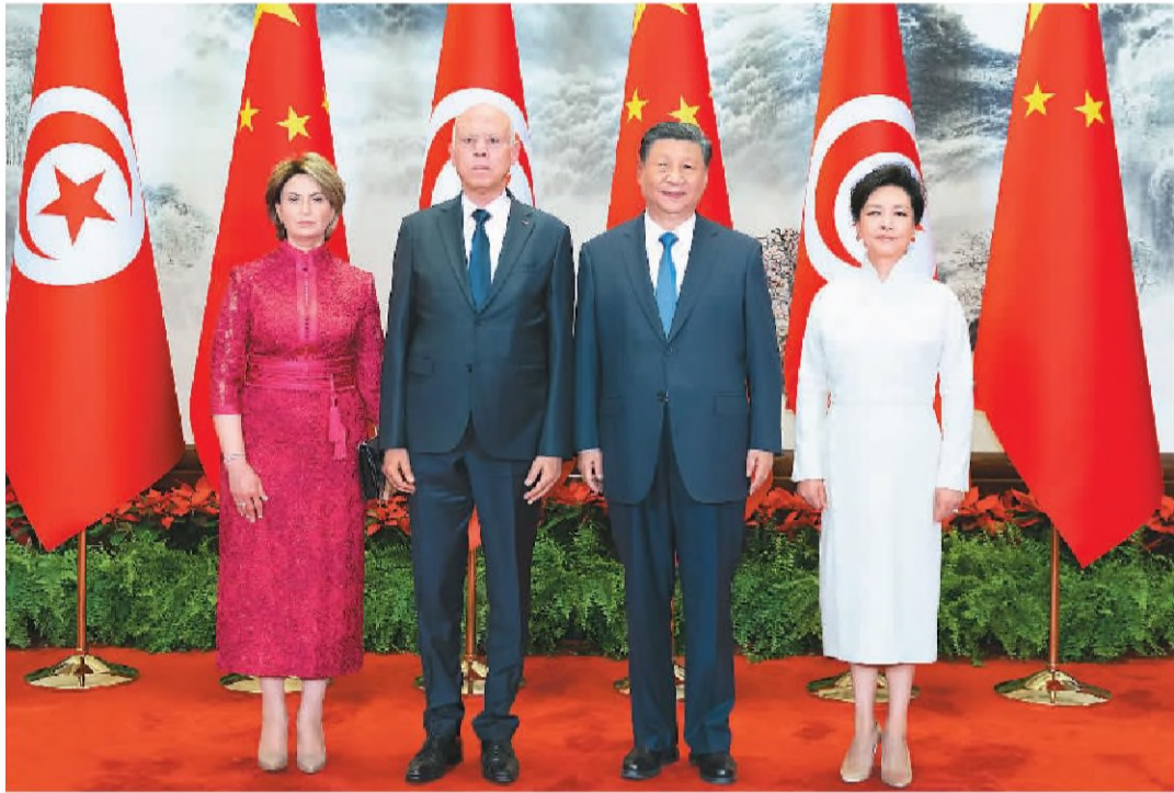
五月三十一日上午,国家主席习近平在北京人民大会堂同来华国事访问并出席中国—阿拉伯国家合作论坛第十届部长级会议开幕式的突尼斯总统赛义德举行会谈。这是会谈前,习近平和夫人彭丽媛同赛义德和夫人伊什拉克夫妇合影。