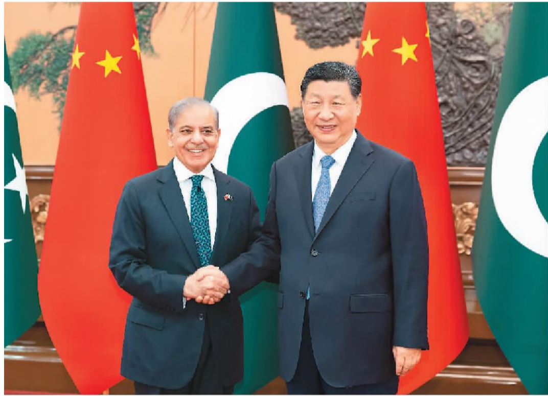
六月七日下午, 国家主席习近平在北京人民大会堂会见来华的巴基斯坦总理夏巴兹。