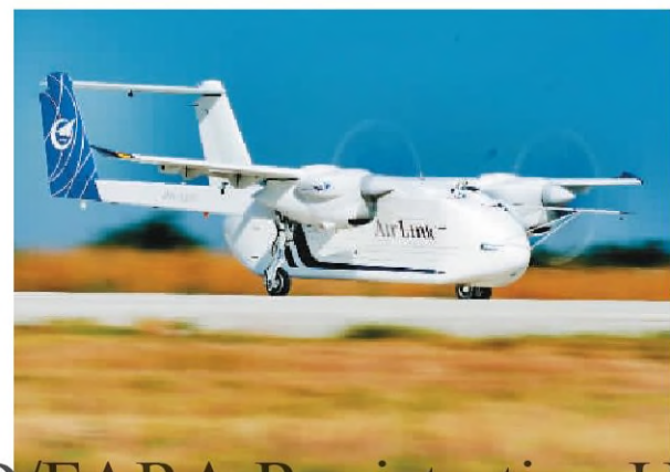
6月12日上午9时25分, 由中国航空工业集团自主研发的HH-100航空商用无人运输系统验证机在西安蓝田通用机场首飞成功。

该机主要应用场景为支线物流, 可扩展森林草原防火、救援物资投送、应急中继通信、人工影响天气等应用场景。