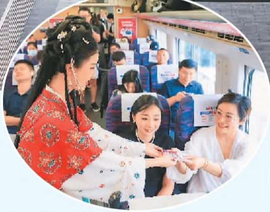
▲ 6月15日,G8388次列车从上海站发出,途经长三角19个站点后,回到上海虹桥站,实现长三角“环线”运营。图为G8388列车驶入苏州站。 ▶ 在长三角环线高铁列车上,旅客获赠纪念品。

凤凰花又开,鹭鸟再相会。6月15日,第十六届海峡论坛大会在福建厦门举行。今年海峡论坛延续“扩大民间交流、深化融合发展”主题,两岸同胞通过论坛交流交友交心,厚植情谊、增进福祉,越走越近、越走越亲。论坛的成功举办,充分彰显了两岸同胞反对“台独”、希望两岸关系和平发展、积极探索融合发展新路的主流民意,对于进一步扩大两岸交流、凝聚两岸人心、拉近两岸距离、增进同胞感情具有重要意义。