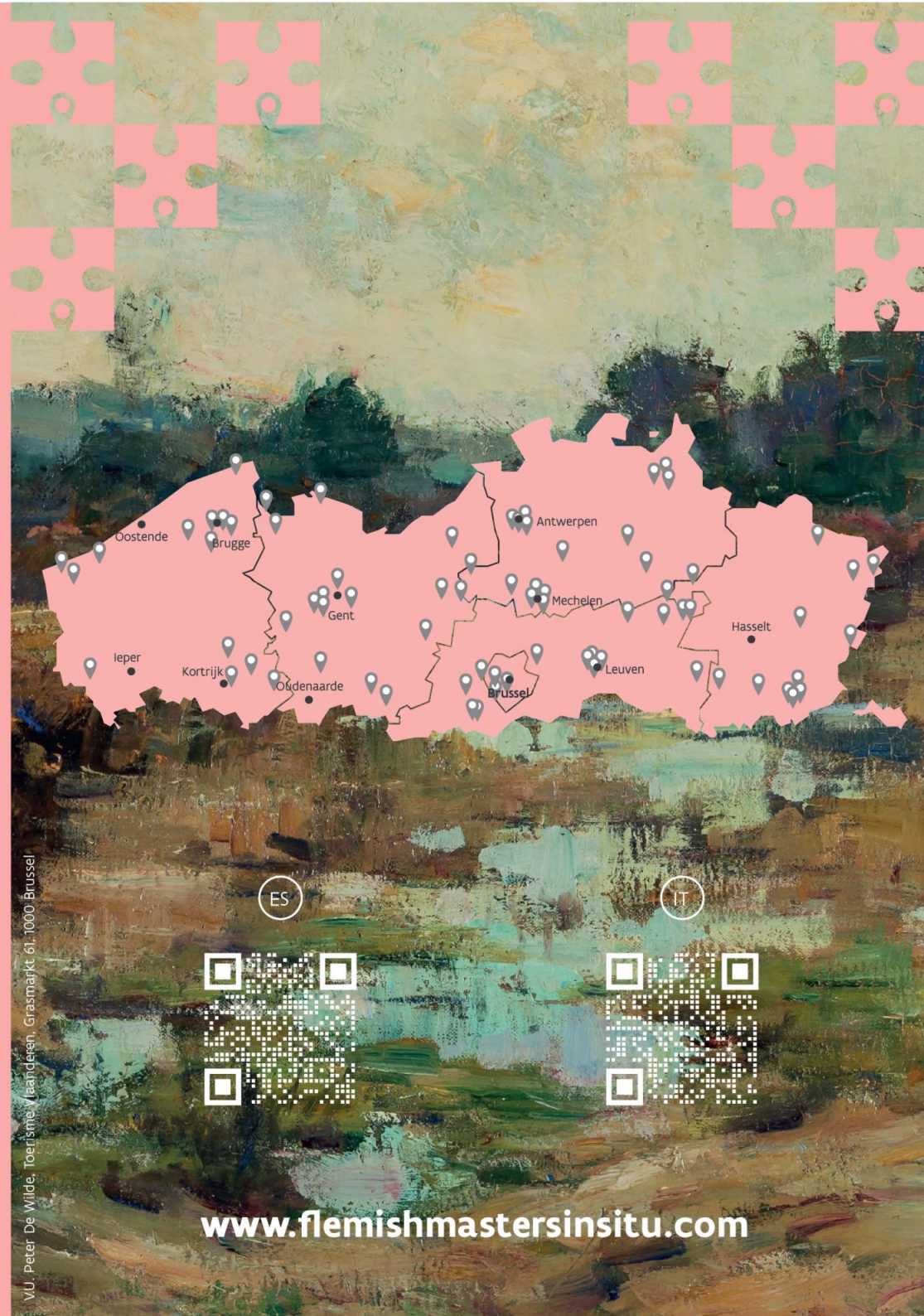
VU - Peter De Wilde, Toerisme Vlaanderen, Grasmarkt 61, 1000 Brussel