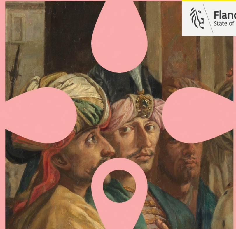
© Nieuwpoort: Dominique Provost Art in Flanders. Het oordeel van Cambyyses - Vigor Boucquet