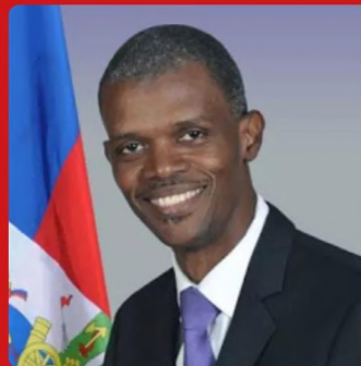
MATHIAS PIERRE Minister Delegate in charge of Electoral Matters and Relations with Political Parties Ministre Délégué Chargé des Questions Électorales et des Relations avec des Partis Politiques