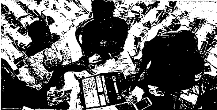
Amid an internet blackout, Congo delays election results Just over half the votes have been counted, says the electoral commission. Voters small a rat economist.06.17

It has been difficult to get reliable information in Congo. The internet and text-message services have been turned off across the country